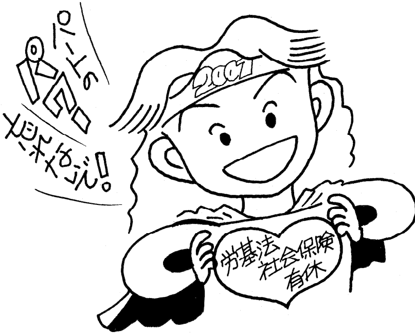
パート労働者の規模別人数と賃金の比較（2000年3月分）