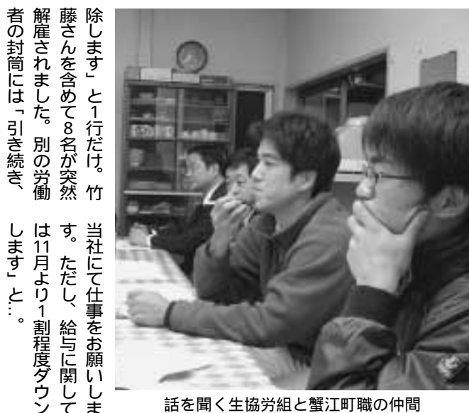
話を聞く生協労組と蟹江町職の仲間

突然、紙切れ1枚で8名が解雇、残る社員に対しても「賃金10%カット、サービス残業も休日出勤もしてもらえないなら辞めてもらう」と、会社のむちゃくちゃなやり方に青年達が組合を結成してたたかいに立ちあがっています。「自分のまわりでも、こんなひどいことがあるなんて」、同じ地域に働く名勤生協労組と蟹江町職労の仲間が話を聞きました。