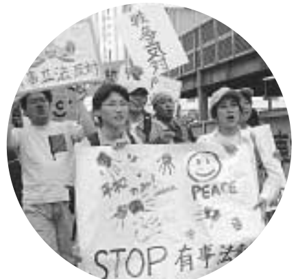
6月16日には名古屋市中区の栄で、「僕らは戦争に協力しない」と青年がピースウォーク