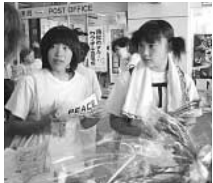
高校生は有事法制の危険な内容を聞かされビックリ。愛労連婦人協が6月22日、金山総合駅で宣伝。

社民党・新社会党が共同した6・2県民集会。目標を大きく超える賛同が寄せられた朝日新聞へのカラー意見広告掲載運動。県下で47万筆、愛知県医師会や連合愛知もあわせると150万筆を超える医療改悪反対署名など大きなとりくみが世論を動かしています。