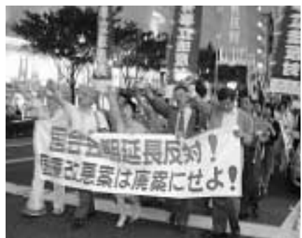
「もう、小泉内閣は退陣しかない」と6月12日に名古屋市中区栄で開かれた緊急集会には、300人が参加