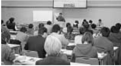
2月には106人が最賃生活体験「最賃では生活できない」が参加者の実感

最低賃金闘争はいよいよヤマ場を迎えます。中央最低賃金審議会は、7月26日に発表する最賃引き上げ「目安」にむけて審議をすすめています。県労働局長は、この「目安」を受け、愛知県最低賃金審議会に諮問します。そして審議会が8月6