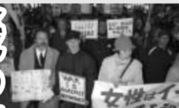
無法なイラク攻撃が開始された3月20日の緊急集会に800人参加