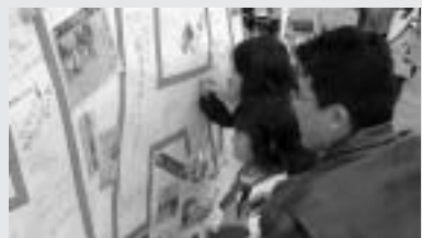
米大使館への怒りのメッセージボードには青年や親子連れが次々に