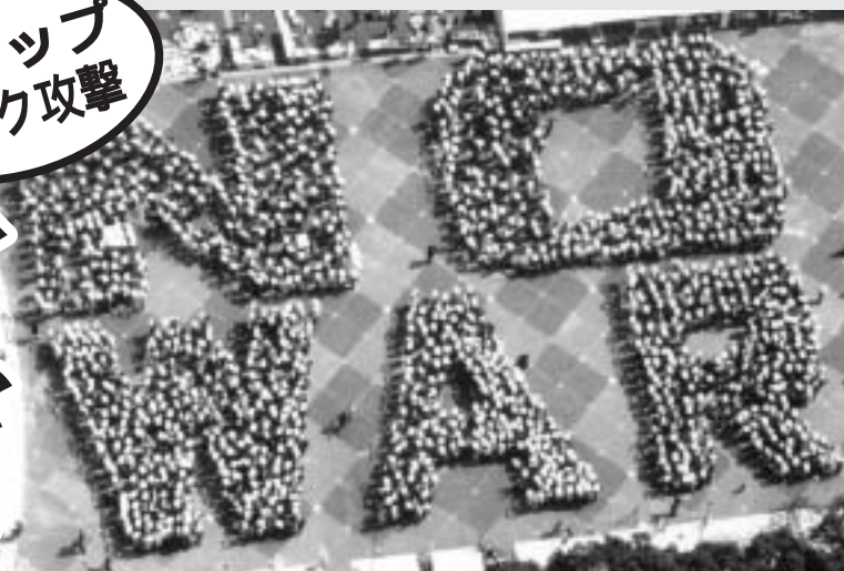
3.23ピッグフェスタでは3000人の人文字でアピール