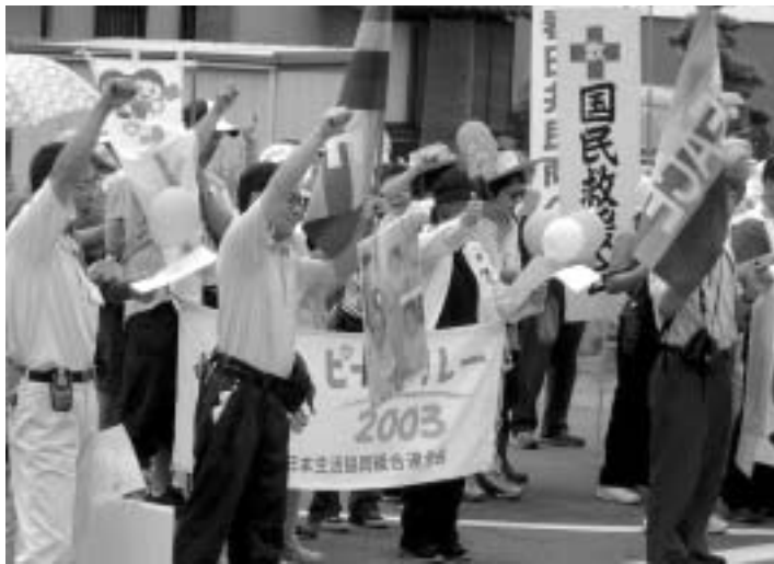
イラクやアフガンでのクラスター爆弾被害者のパネルをかがけて抗議する平和行進の参加者たち(高蔵寺弾薬庫前にて)

され人々の命を奪い、今も不発弾が子どもたちの命を奪い続け、「キッズ・キラ」呼ばれています。 マスコミの報道によれば、航空自衛隊は7年度から02年度にかけて購入に148億円をかけており、1発が1万4000ドルすることからその保有数は9000発程度と推測されています。