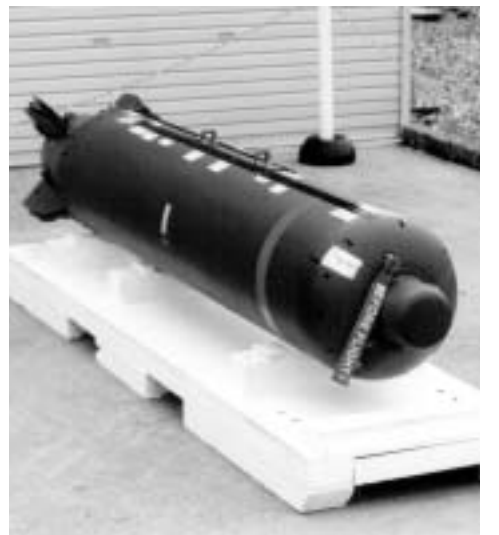
堂々と展示されたクラスター爆弾

弾薬庫の開庁45周年記念基地開放で明らかにしたクラスター爆弾の配備・保管に、イラクなどでの犠牲者のパネルをかけた強く抗議しました。