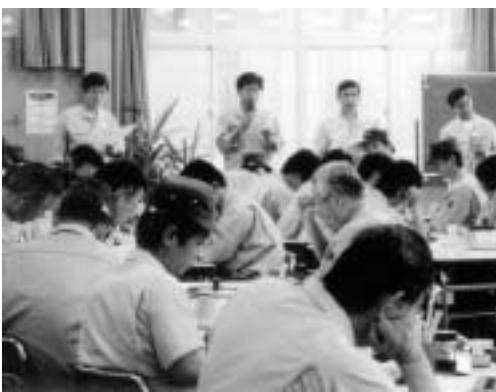
川本製作所支部で開かれた職場集会