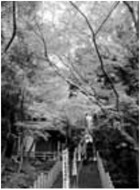
文・写真 市場文規 (あるきにくの会代表)

名古屋近郊で一番遅い紅葉ス ポットと言えば、犬山の寂光院。今 年の見頃は12月初旬か？ 名鉄犬山遊園駅から木曾川沿い に上流に向かって30分ほど歩くと 参門に着く。そこから長い石段が 続く。両側は楓の古木が立ち並