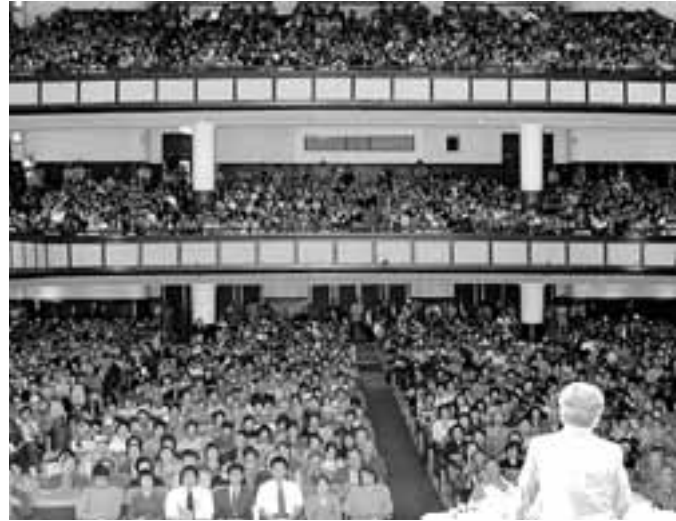
3200人が参加し、1000人の第2会場も満員になりました

新潟県中越地震。母子3人のワゴン車が土砂崩れに巻き込まれた事故の救出現場の中継(録画)をご覧になった方も多いと思います。余震で画像が揺れ動くたびに、「消防隊員や警察官は大丈夫か」と、ハラハラドキドキしました。 労働安全衛生法第20条から第25条の2までに、労働者の危険又は健康障害等を防止するために、事業者が必要措置を講ずべきことを規定しています。例えば、21条2項では「事業者は、労働者が墜落するおそれのある場所、土砂等が崩落するおそれのある場所等に係る危険を防止するために必要な措置を講じなければならない」と。今回の魚沼市の救出、収容現場での、安全を確認し、二次災害を発生させないようにしながらの作業に当てはまります。 さて、そこで問題。消防隊員と警察官は、労働者の安全と健康を確保し快適な職場環境の形成を促進することを目的とする労安法の対象となる、労働者でしょうか。