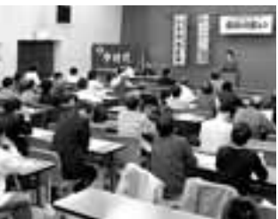
市長選に向け市民のつどい(中村)

要望した。青年の雇用問題では職安と共同で取り組んでいる」などの回答が出されました。 夜は、名古屋市内で市長選を視野に入れた要求交流集会や学習会が14カ所で開催され、市長選に向けての一步が踏み出されました。