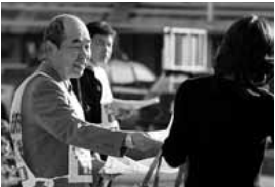
名鉄津島駅での海部・津島労連の早朝宣伝

秋年末闘争最大のとりくみとなった10・28地域総行動は、県下150カ所での早朝宣伝行動にはじまり、様々なりくみが終日繰りひろげられました。 日中、名古屋市内ではトヨタディーラーへの訪問を 10地域労連が50カ所でおこない、サービス残業の是正、青年の雇用増、正社員化、排入規制問題などを申し入れました。残業問題では「営業は見なし労働時間で1日1時間の残業代をつけている」うちはサービス残業はない」など、お茶もでて比較的对応がよく話ができたとの感想も寄せられました。 名古屋市内では、青年の雇用・最低賃金制の確立、緊急雇用助成金などで自治体要請を行い、尾西市では「緊急雇用助成金の継続を国に