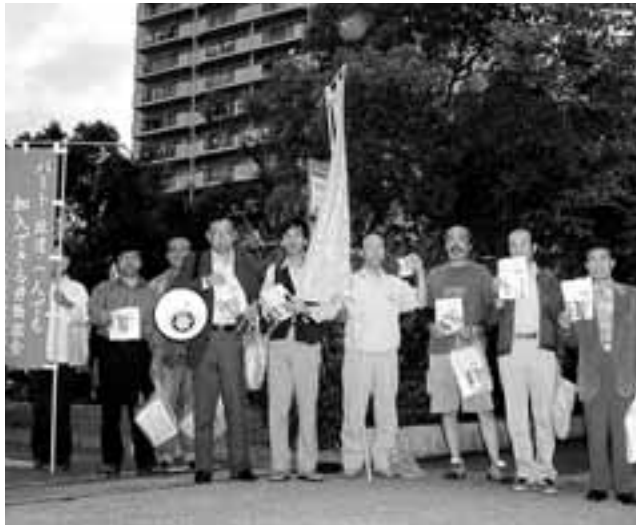
団地での音の宣伝とピラまきを終えて

10月3日に熱田区の桜田 団地で400枚のピラを全 戸配布したところ、早速メ ールが、普段一人きりで仕 事をしていた相談者にとつ て日頃言えない仕事上の悩 みを打ち明ける事が出来る 労働組合は心の支えになる と即加入しました。その勢 いに乗って3つの支部（東 部・東三河・知多）がきず な独自のピラと愛労連作成 の組織拡大リーフをセッ トして5500枚を配布。 11月4・7日には、のぼり を立て「集中労働相談会」 を開くなど積極的に活動し ています。