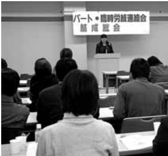
非正規労働者の劣悪な実態がリアルに報告された

11月21日(日)労働会館東館で60人が参加し、愛労連パート・臨時労働者連絡会が結成されました。全国で15番目の連絡会です。自治労連・福保労・建交労 生協労連のパート労働