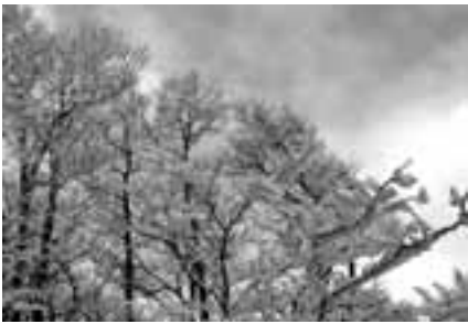
昨年12月23日に高見山で撮影