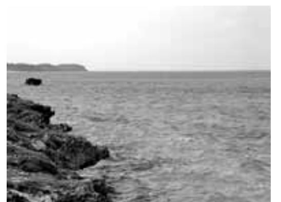
下地島空港をとりまく伊良部島の海

下地島空港 沖縄県宮古郡伊良部町に所在。1969年、琉球政府がジェットパイロットの訓練飛行場として誘致。1980年から定期便(YS11型機)が就航したが、利用客が少なく1994年に運休し現在に至る。3000mの滑走路を有する。復帰前の琉球政府と日本政府の間で「民間航空訓練及び民間航空以外の目的に使用させない」とした覚書を交わしています。沖縄米海兵隊は、2001年以降、地元自治体が反対するなか、燃料給油を口実に同空港の使用を繰り返しています。