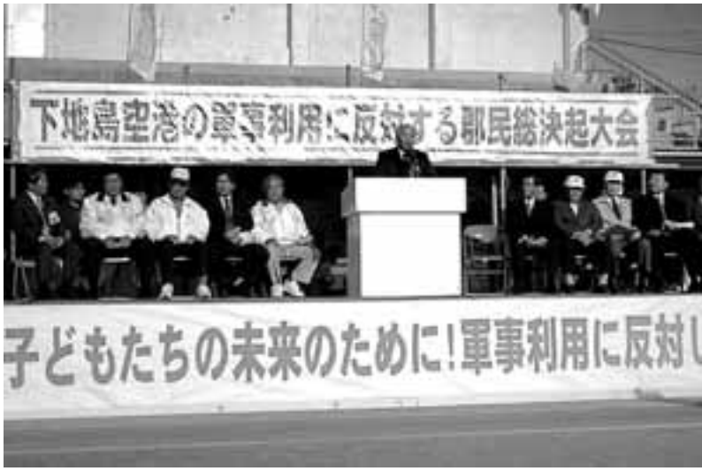
挨拶に立つ大会実行委員長である伊志嶺亮・平良市長