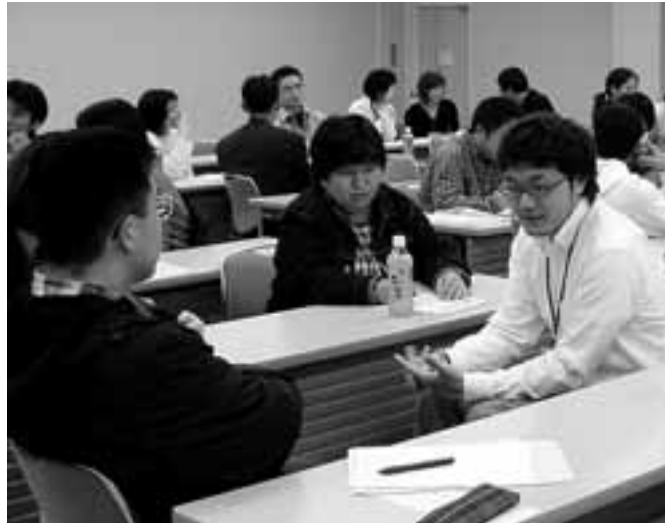
「みんなの意見が聞けていい」と好評だったワークショップ

事業者の責務は、労働安全衛生法第3条1項で「この法律で定める労働災害の防止のための最低基準を守るだけでなく、快適な職場環境の実現と労働条件の改善を通じて職場における労働者の安全と健康を確保するようしなければならぬ」と規定しています。 労安法が「最低基準」であること、「快適な職場環境の実現」と「労働条件の改善」を掲げていること、そして、事業者の努力義務ではなく「しなければならぬ」としていることに注目してください。労安法は労働基準法と姉妹関係にあるゆえんです。労働者の安全と健康を確保するために、単に職場環境の改善だけでなく、労働時間の短縮、有給休暇の完全取得などの要求の根拠がここにもあるのです。 さて、消防職員は労安法という労働者か。「消防と防災をよくする名古屋市消防職員会」の仲間たちに聞くと、「安全衛生委員会はありません」と。