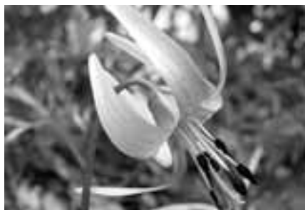
4月初旬には森の妖精カタクリの花に出会える

冬でも雪の心配をせずに歩ける山のひとつに豊橋の葦毛湿原から弓張山地(神石山)コースがある。