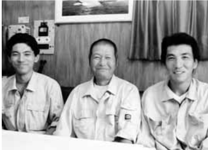
誇りの持てる仕事だからこそ安心して働き続けたいと白龍の仲間

とき 10月28日(金) 18:30~ ところ 栄広場 (名古屋市中区・栄交差点角) 終了後、若宮大通りまでデモ行進