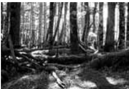
尾高山のシラビノ林