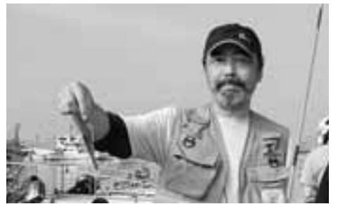
なかなかの大物でしょう