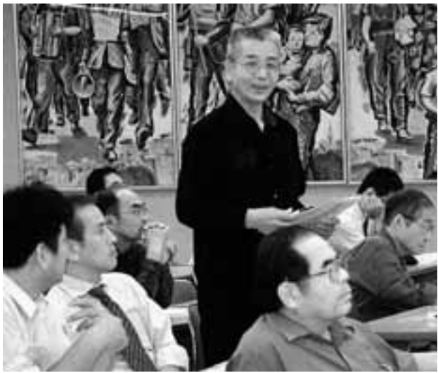
会場からは積極的な発言が相次ぎました