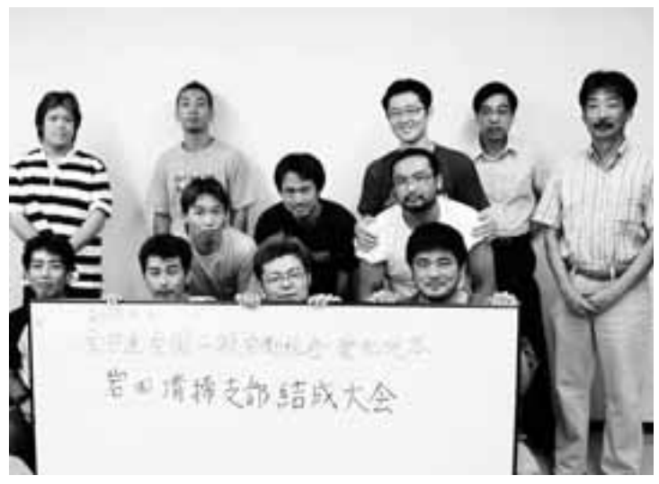
結成大会に参加した岩田清掃支部と尾東労連の仲間たち

瀬戸市にある産業廃棄物等運搬処理会社の岩田清掃で、全労連・全国一般岩田清掃支部が9月4日、過半数を超える仲間で結成されました。 長時間・過密労働 従わなければ恫喝 同社では、深夜1時過ぎから昼過ぎまでの長時間労働が恒常化し、休日は日曜日だけ。その上タコメーターで行動を監視される過密労働が続いてきました。残業代も深夜勤務手当も払われず、子どもが病気で有給休暇を取ろうとすれば「やる気があるのか」と恫喝され、親戚に不幸があっても休みを取ることはできず、管理職による仕事上の差別と激しいパワーハラスメントが横行してきました。 重大な人身事故を機に 尾東労連へ相談 こうした中、業務中の重大な人身事故が発生。「いつか自分が事故を…」と過労死してしまおうとドライバーたちが集まり、自治体で働く家族(組合員)の紹介で尾東労連に相談したのがきっかけでした。 その後、尾東労連と全国一般で組合づくりの援助に入り、結成前日の9月3日には組合加入通告と要求を提出しました。現在、過重労働問題を中心に団体交渉が続けられています。