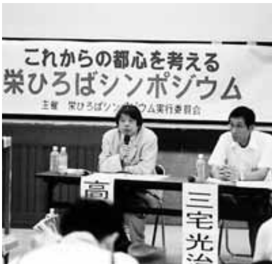
それぞれの立場から発言するパネラー