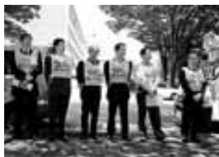
裁判所前で原告のみなさん

国会に出された労安法改悪案は、残業月100時間、本人申し出を条件に産業医の面接指導を受けることができるとしています。残業時間が月60時間を超えると身体的不調が目立つようになり、自殺を考慮することも急増するという報告も。働き過ぎが原因の過労死、過労自殺が増えるばかりなのに日本経団連の要望はさらに拍車をかけます。「労安法と労基法とは車の両輪である」ことが、改悪にも現れています。