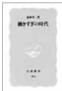
働きすぎの時代 森岡孝二 [著] 岩波新書 定価780円+税

職種・官民を問わず、長時間・過密労働の働き過ぎの時代である。本書はその背景をグロバル化・高度情報化・消費社会・規制緩和にあるとしている。とりわけITによる情報化は仕事と生活を一変させた。過労死とつづ病 職種・官民を問わず、罹患の労働者を生み出し、サービスのスピード化はその背後に大量の非正規労働者をつくりだす。人権は蹂躪され、機械の部品のように使い捨てされる労働者。本格的な労働時間短縮のたまたまいが求められている。