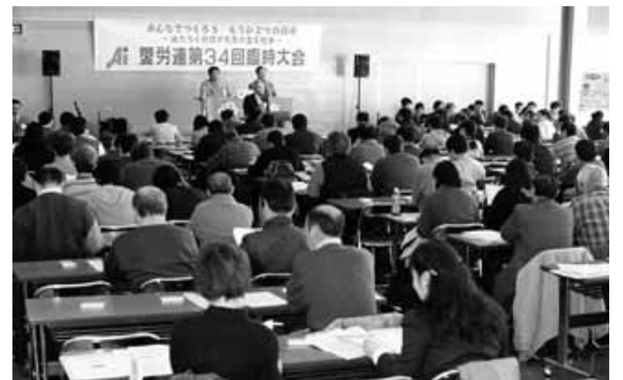
来賓のあいさつを聞く大会代議員

また、樽松事務局長の総括答弁では、賃上げ闘争に闘わってすべての組合が月給だけでなく時間給でも要求提出を必ず行いそれを愛労連に必ず集中すること、ストライキには、愛労連や公務組合、地域労連から支援にはいることなどが再確認されました。