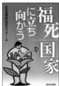
「福死国家」に 立ち向かう 新日本出版社 定価1,700円+税

小泉流「構造改革・新自由主義」のもとで、所得格差が広がり、低所得者層が増大している。「格差拡大は悪くない」とうそぶく小泉首相。「小泉政治」によって国民のいのちと健康がうばわれ、憲法25条の生存権が踏みこた