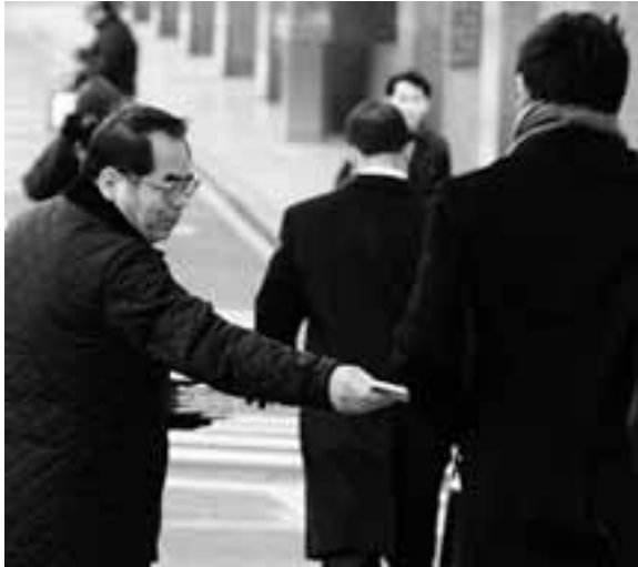
全労連の日経連包囲行動に合わせてトヨタ名古屋本社、中電本社、刈谷駅で行われた早朝宣伝

トヨタ労組が4年ぶりにベースアップ要求を決定しました。トヨタのベースアップは全国的にも賃上げの重しになってきました。トヨタが賃上げを行えば賃上げ抑制の口実が一気に崩れます。今年は「賃上げ春闘の復活が予想される」(中白)と報道されています。 私たちは全国に訴え、3年前から全国的な位置づけでトヨタ総行動をとりにく