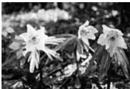
2003年2月、旧鳳来町石雲寺にて撮影 文・写真 市場文規(あるきにすとの会代表)

2月節分の頃に咲く花、その名も節分草。透けるような白い花びらに黄色の雄しべと青紫の雌しべ