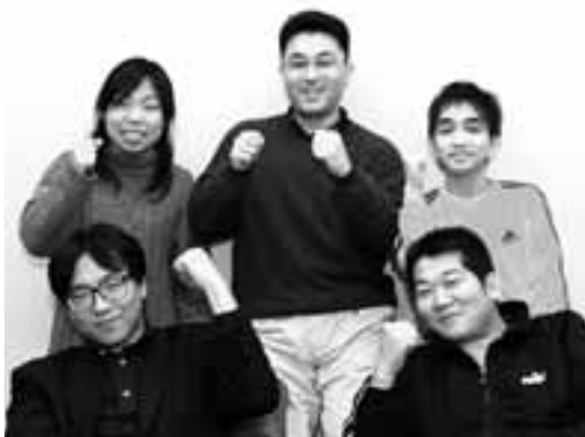
愛労連青年協の元気な役員たち

1月26日におこなわれた、最低賃金学習決起集会に青年協から3人が参加して学びました。最低賃金とは使用者が労働者に対して支払わなければならない最低限度の賃金のことです。時給制が多い非正規労働者が半数を占める青年層にとって、最低賃金引上げは大きな意味をもちます。フランスやオランダでは最低賃金がしっかり