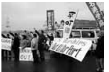
名古屋港での抗議行動(1/30)

を守る愛知の会、平和と憲法をまもる港区連絡会は、30日の入港時に、岸壁での抗議行動を実施。同日午後には、名古屋市長と愛知県知事に抗議の申し入れを行いました。