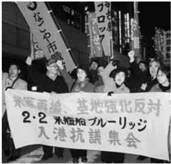
米領事館に向けてパレードする参加者(2/2)

米海軍第7艦隊旗艦のブルーリッジが1月30日午前、名古屋港の金城埠頭に入港しました。これに対し愛知県実行委員会、憲法と平和