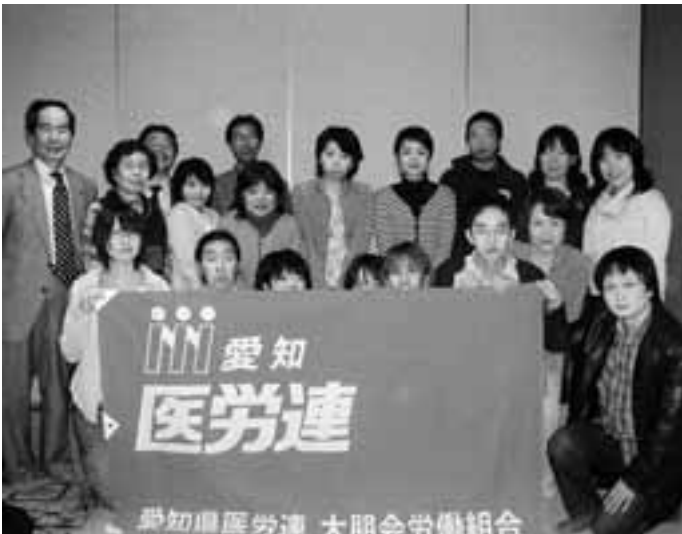
大朋会労働組合の仲間たちと激励に駆けつけた人たち

3月22日、岡崎市にある医療法人大朋会の岡崎共立病院（療養型病床）で働く職員31名が大朋会労働組合を結成。愛知県医労連と岡崎額田地域センターに加盟しました。翌日23日には、組合結成通告と要求書を提出。4月に交渉を持つ予定となっています。要求内