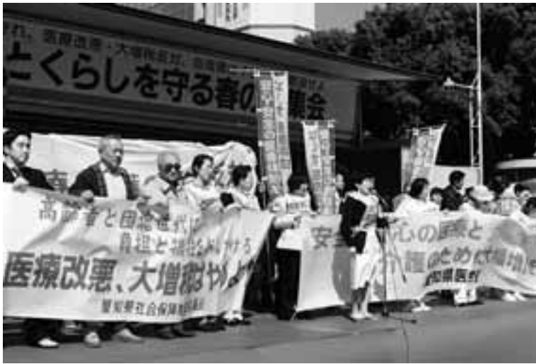
憲法・教育基本法・医療改悪反対、大増税やめると開かれた3.19春の大集会には4000人が参加し大きくアピール