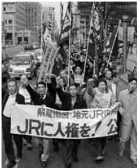
集会後、栄の繁華街をデモ行進する参加者

4月1日、国鉄闘争を支援する東海の会主催で、民営化20年JR不採用事件の早期解決をめざす4・1集会、名古屋市中区役所ホールで開催され、320人が参加しました。