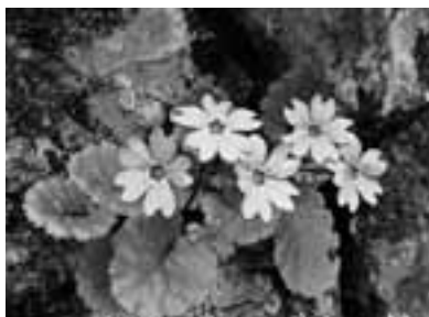
2005年5月4日に舟伏山で撮影 文・写真 市場文規(あるきですとの会代表)

「昨年、初めて舟伏山を訪れた時、「ヤマシャクヤクが咲いていましたよ」と声をかけると、「気がつかなかった。残念!イワザクラ