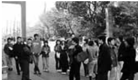
靖国神社の参道で説明を聞く参加者