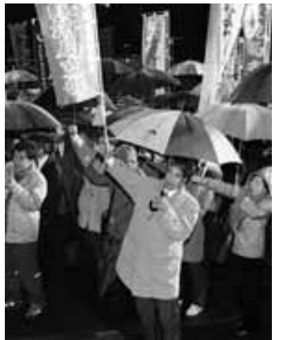
3.16春闘決起集会には「低額回答はねかせ」と嵐のような雨風にもかかわらず、500人が参加

3人体制」を確立するなど成果をあげています。引き続き「看護師増やせ、辞めさせない条件づくり」と運動を強めています。原油高と規制緩和で交通・運輸部門は業界全体が厳しい経営環境になっています。賃金も低く抑えられ、運転手の不足も深刻です。建交労やタクシー協議会では安全な運行を守るためにも雇用の安定が必要と経営者団体や行政への働きかけを強めています。名古屋港ではトヨタの輸出が増え、全国一の工業製品取り扱量となっているにもかかわらず、儲けは労働者に回っていません。全港湾では13組織中8組織で「ゼロ回答」でしたが、組合は集団交渉、対角線交渉