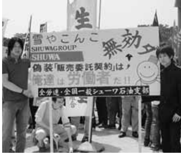
初めてのメーデーにジャンボプラカードを作って参加した全国一般シューワ石油支部の仲間たち

「雪やこんこ あられ やこんこ」と流しながら石油を販売しているタンクローリー。見たことがあるのではないだろうか。愛知県内で灯油の巡回販売に従事している販売員10人が「就労の実態は労働基準法に基づく雇用労働者であるとして、全労連・全国一般愛知地本シューワ石油支部を結成。灯油販売のシューワ石油名古屋に雇用関係の確認や未払い賃金の支払いを要求しています。彼らは求人誌に掲載された同社の社員募集広告など 「雪やこんこ あられ やこんこ」と流しながら石油を販売しているタンクローリー。見たことがあるのではないだろうか。愛知県内で灯油の巡回販売に従事している販売員10人が「就労の実態は労働基準法に基づく雇用労働者であるとして、全労連・全国一般愛知地本シューワ石油支部を結成。灯油販売のシューワ石油名古屋に雇用関係の確認や未払い賃金の支払いを要求しています。彼らは求人誌に掲載された同社の社員募集広告など