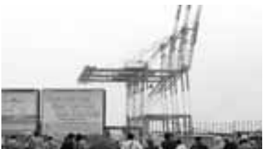
4/23 革新県政の会が神田県政によるムダ使い公共事業をチェックするため、県政ウォッチングを実施