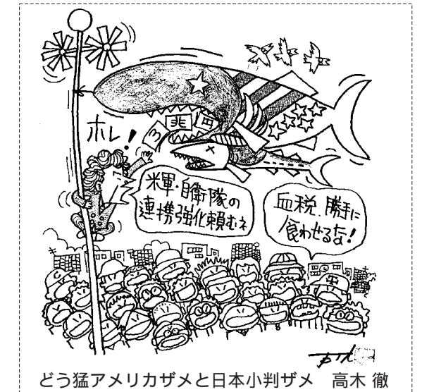
どう猛アメリカザメと日本小判ザメ 高木 徹

「憲法九条にノーベル平和賞を」教育基本法の改悪はゆるぎない。自衛隊はいつから撤退せよ。大企業は社会的責任を果たせ。郵便局の統廃合反対。公共サービスを取り捨てる許すな。看護師増やして安心。安楽死の医療を。5月1日、名古屋市中区の日川公園にはどどどと、さまざま