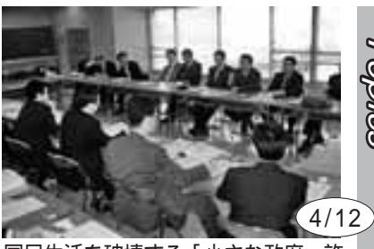
4/12 国民生活を破壊する「小さな政府」許すなど全労連キャラバンが愛知入り。県や名古屋市への要請と宣伝を実施

第77回愛知県中央メーデーに5000人、県下6地域メーデーに2000人が元気に集う