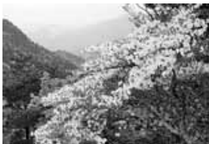
鎌ヶ岳に咲くシロヤシオ 文・写真 市場文規(あるきにすとの会代表)

名古屋方面から鈴鹿連峰を眺めると一番南端にひとときわびフミタに尖った山が見える。それが鎌ヶ岳だ。5月中旬、眩いばかりの新緑に誘われて、鎌ヶ岳を訪れると、中腹から山頂にかけて真っ白に輝く花が目飛び込んでくる。近づけば、透けるように白い花を一杯に付けたシロヤシオ。木々の緑に映える真白き花。その様は言葉では表現する術もない。足下にはピンクのイワカガミが彩りを添える。足に自信のない人でも湯ノ山スカイラインを利用すれば、御在所と鎌ヶ岳の間、武平峠まで車で行く。そこからはやや急な登り(鎖場)もあるが、40分程度で頂上に立てる。