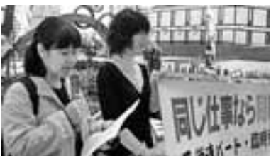
4/16 均等待遇と最賃引き上げを求めてパート臨時労組連絡会と最賃闘争委員会が合同で宣伝行動