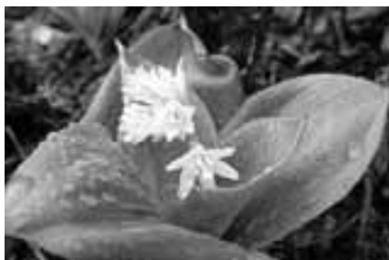
2003年5月に黒姫山(信越国境の山)で撮影 文・写真 市場文規(あるきにすとの会代表)

ツバメオモトの群生地の名前に惹かれて下呂市萩原の御前山に登ったことがある。眺望のない山道 を登り詰め、頂上部に着くといきなり御岳が目の前一杯に広がる感動的なクワイマックスが待っていた。ではあるが、肝心のツバメオモトは「ツバメオモト群生地」の看板だけで何処にも見あたらない。それだけにあこがれ募るツバメオモト。3年前、残雪に道を失い、雨にまで追い打ちをかけた5月末の黒姫山(信越国境の山)で、あこがれの女(ひと)が雨に濡れてひっそり佇んでいた。まるで私の来るのを待っていたかのよう。6月初旬の天生温泉ではいたるところにみられる。