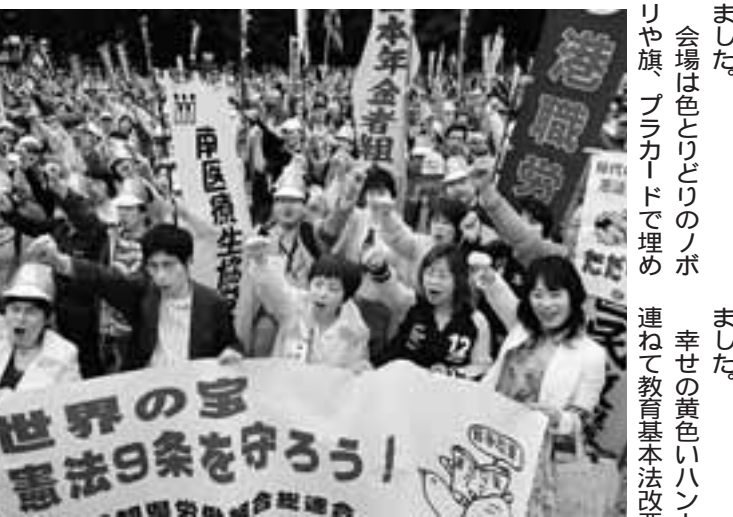
ガンパローをする愛知の代表団

有給休暇もほとんど取れない過密労働のなか、些細なミスに対しても一方的に処分が科せられるなど、人間としての尊厳が踏みじられていたことで、霊柩輸送の仕事は、事故やミス、トラブルなどを起こさないよう細心の注意をはらって働く環境の下で、信頼される質の高い仕事を求められます。会社のやり方に対し、労働者は「ゆとりある勤務への改善や社員の尊厳が大事にされる職場