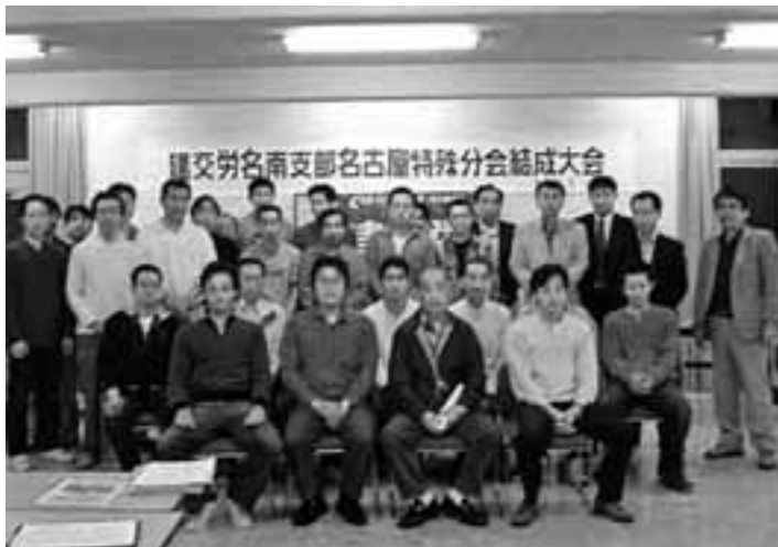
結成大会に集まった建交労名古屋地域支部名古屋特殊分会の仲間

5月13日、名古屋特殊自動車(霊柩輸送)で働く労働者が建交労名古屋地域支部・名古屋特殊分会を結成しました。名古屋特殊自動車は、愛知県内に6つの営業所があり、約1000人の社員、霊柩車や送迎バスなど122台を保有し、全国霊柩自動車協会の会長企業でもあります。