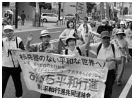
岡崎市から安城市をめざして(6月2日)

2006年原水爆禁止国民平和大行進が5月31日、静岡県から愛知入りしました。県内では、国民平和大行進実行委員会と市民平和行進実行委員会が平和行進共同連絡会を結成し、県内