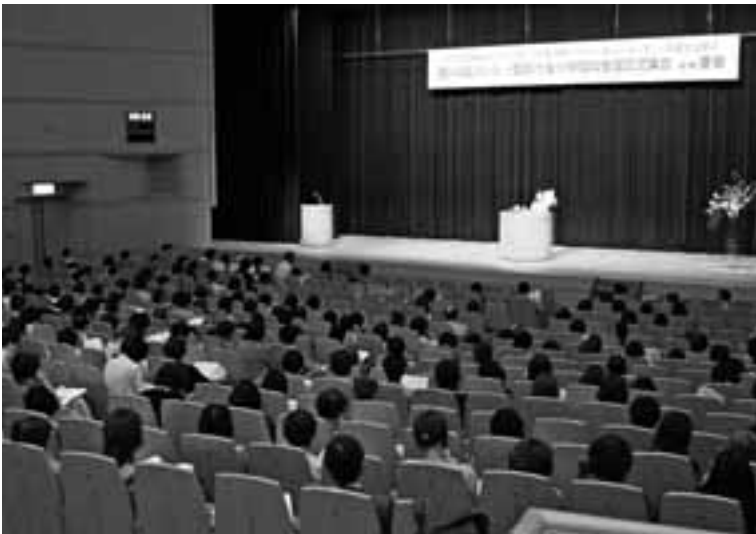
全国から熱いたたかいが報告された1日目の全体集会