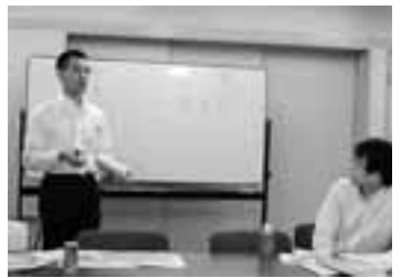
青年部役員や若手役員が講師を務める学習会

どこの民主団体と共闘 し、宣伝の際は、連絡会 が独自作成した横断幕を はって、目に訴える行動 を意識しています。 ゆづらん船で 船上パーティ 「2年に1回、名古屋