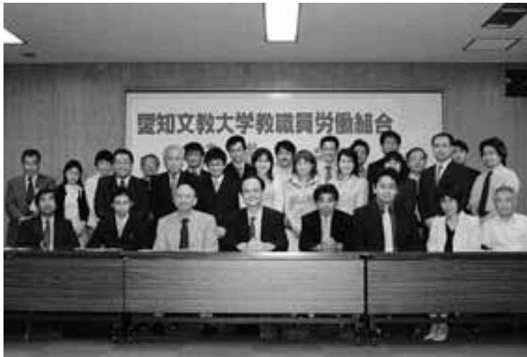
結成大会に集まった愛知文教大学教職員労働組合の仲間たち