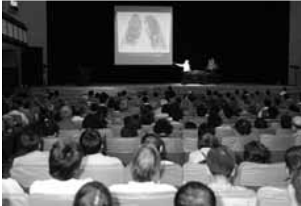
海老原先生の講演を聴く参加者

6月18日、名古屋市公会堂で、「なくせ、じん肺アスベスト愛知県民集会」が約500名の参加で開催されました。7月7日の東京地裁判決(原告勝訴)を直前に控えた市民集会となったこの集会には、建交労働組合、愛労連など多くの労働組合関係者、医療団体や患者組織、行政関係者などが集まりました。