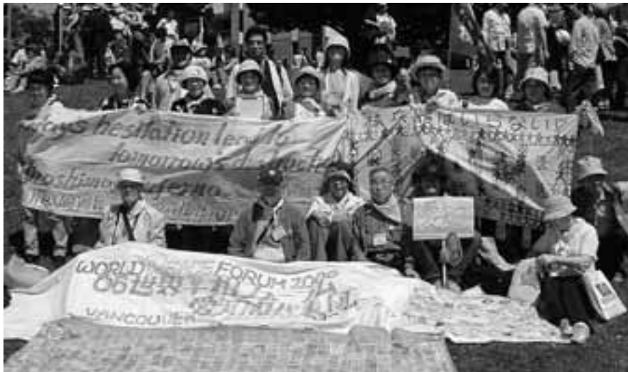
バンクーバーでの反戦パレードを終わって集まった愛知からの代表団