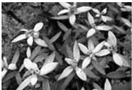
南アルプス仙丈岳稜線で撮影

エーデルワイス、エーデルワ イス……。この曲と歌詞に魅せられ て山に登る輩も多いのでは?和名