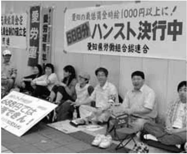
ハンストに参加した仲間たち