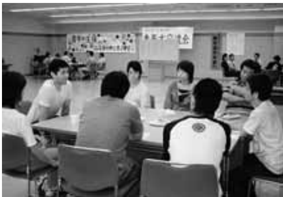
討論のコーナーで職場の実態を話しあう参加者

6月25日(日)青年協主催の「青年大交流会」では、労組以外に民青同盟・県学連の仲間を加えた41名の参加者が集まりました。