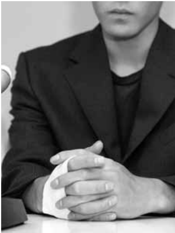
労災による右手のケガはまだ治っていない (記者会見をするKさん 9月19日)

いま大企業の製造工場で偽装請負が急増しています。そこに働く労働者は、ほとんどが低賃金、無権利状態で働かされています。トヨタ車体精工(株)では、労災かくし・偽装請負が発覚。告発した労働者を採用差別するなど、大企業の違法・不法な行為がまかりとおっています。