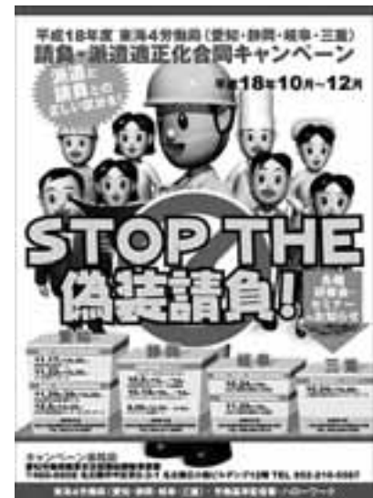
労働局も偽装請負問題でキャンペーン

とくくみでは、団体、地域で活動を本格的に再開し、ビデオ『ビジョナル県政ウォッチング』などを活用した学習運動や、県民の暮らしを守る緊急署名」を