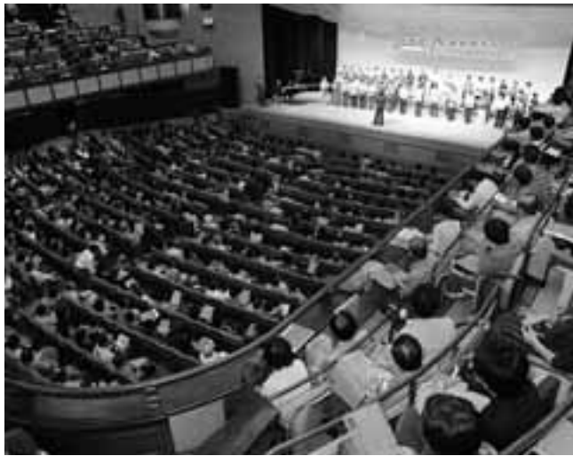
「戦争する国づくりは許さない」と11月3日に開かれた憲法九条を守るう'06県民のつどいには2000人が参加