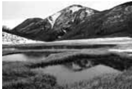
2006年10月11日に火打山・天狗の庭にて撮影 文・写真 市場文規(あるきですの会代表)

雪深い信越国境の山には湿原が広がり、秋にはオレンジ色の草紅葉に覆われる。そんな情景を求め