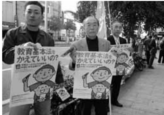
名古屋市内のホテルで開催された教基法地方公聴会に合わせ行われた宣伝行動に約40人が駆けつけた(11月8日)

教育基本法改悪をめぐる緊迫した情勢を迎えています。いじめ自殺問題や高校の未履修問題、タウンミーティングでの政府による「やらせ質問」など様々な問題が噴出しているにもかかわらず、政府・与党は11月14日にも衆議院通過をねらい、特別委員会での採決をゴリ押ししようとしています。こうした中、教育基本法に寄せる思い、守り抜く決意を3人の方に寄せてもらいました。