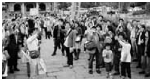
カンパイをする人たち

自治労連の保育職場や医療でパート・臨時の加入が進んでいます。自治労連では五つの自治体を重点にして「臨時・非常勤向け」チラシを1万枚活用し、「仕事の悩み懇談会」などを開催して加入をよびかけています。医療連は7月の定期大会後も組織拡大を継続。39組織中18組織が加入者をむかえています。10月27日の「看護師増やせ」の中央行動には愛知から100名を超す仲間が参加しましたが、職場でも看護師増員の要求で組合員を増やしています。全国一般も組織拡大の決起集会を開催するなど各単産で「月間」がとりくまれています。