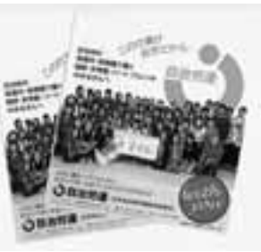
自治体関連の非正規労働者向けのチラシ

自治労連愛知本部は、秋季年末闘争とあわせて、組織拡大強化に大きくとりくもつと、1050人の拡大目標を掲げました。とくに、増える非正規労働者の