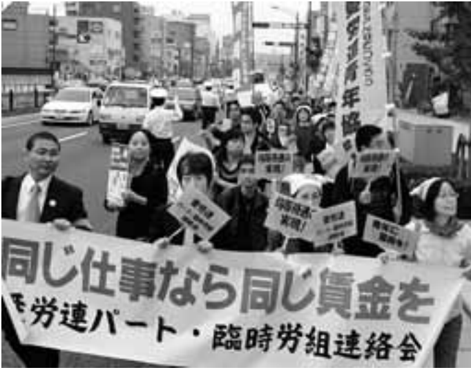
集会後に均等待遇を訴えてデモ行進する参加者