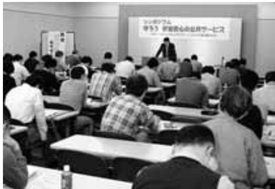
城塚弁護士の講演を聴く参加者

愛労連や公務関係労組などでつくる「住民のための安全安心な公共サービスを守る闘争本部」は、10月15日に名古屋市中区の名証ホールで、シンポジウム「守ろう安全安心の公共サービス」を開催し71人が参加しました。 講演には指定管理者制度や市場化テスト問題に詳しい