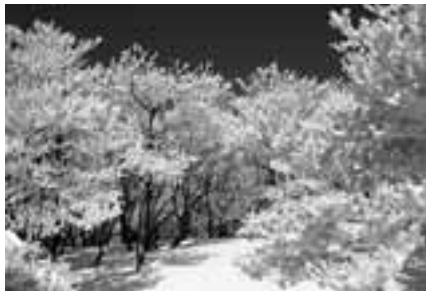
05年12月25日に御在所岳で撮影