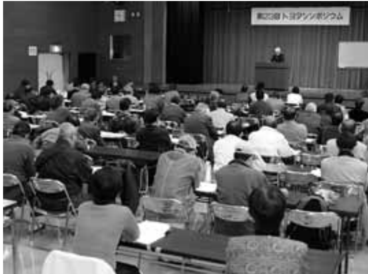
107人が参加した第23回トヨタシンポジウム

第23回トヨタシンポジウムが11月23日、豊田市内の農村環境改善センターで開かれ、トヨタやその関連で働く労働者や地域住民、愛労連傘下の労働組合などから107人が参加しました。