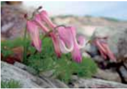
02年7月28日に御在所岳で撮影