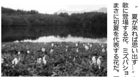
2003年5月19日に黒姫山・古池で撮影 文・写真 市場文規(あるきですとの会代表)

「夏が来れば思い出す……と唄に歌に登場する花、ミズバショウ。まさに初夏を代表する花だ。尾瀬 ばかりが有名だが、信越の山裾にもいくつもの群生地が広がる。黒姫伝説の地、黒姫山麓の古池周辺もその一つ。5月中旬、うるさいほどの小鳥の囀りをBGMに芽吹いたばかりの広葉樹の森を登山口から30分ほど進むと雪を頂いた信越の山々を映す池に出る。池の周囲はミズバショウとそれに彩りを添えるリュウキンカに覆われている。この頃になると黒姫山の南東斜面は雪も消え、簡単に頂上に立てるが、山頂から北東斜面はまだ雪に覆われ、ルートハンティングに難渋した記憶がよみがえる。