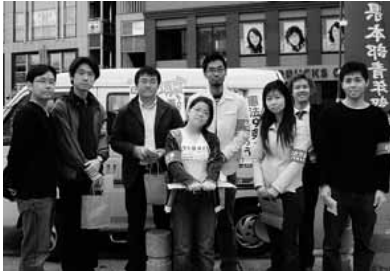
金山総合駅で署名宣伝行動を行った自治労連県本部青年部(4月28日)

とき 6月16日(土)13:30から 6月17日(日)12:00まで ところ 明山荘(蒲郡市・三谷温泉) 地域労連だけでなく単産からも積極的に参加して下さい。