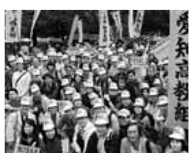
155人が上京した5.27国民大集会

昨年は教育基本法改悪反対に染まった1年でした。愛国心を定め、格差教育をすすめ、そのために学校と教師を縛るといつてもいい改悪です。大雨を衝いて行った緊急総決起集会には380名もの組合員が駆けつけました。「戦争のための人づくりだ」と愛労連が決起して、県内のたたかいは一気に広がりました。9月、10月、11月、12月と県民集会を成功させました。これに無数の学習会や集会・デモが連鎖しました。「9条の会」結成に向けての本格的なとり組みが始まっています。地域での共同闘争も重要です。お互いに声を掛け合って運動を広げていきましょう。