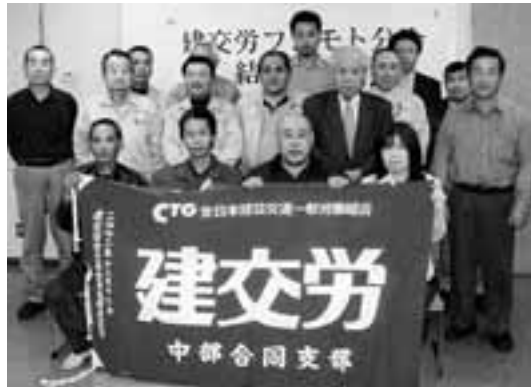
フジモト分会の結成大会に集まった仲間たち