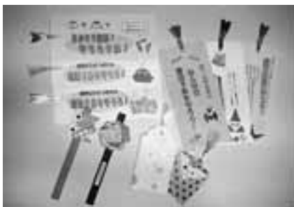
宣伝行動で配布している9条しおり

「9条しおり」は9条の会結成前から、女性部の宣伝行動で配布されています。毎年500から600袋があつたという間になりました。今年度は、9条しおりの会結成前から、女性部の宣伝行動で配布されています。今年度は、9条しおりの会結成前から、女性部の宣伝行動で配布されています。