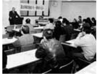
4月21日に開かれた1周年のつどい

日本国憲法は、日本が行った侵略戦争に対する深い反省の上に制定されました。そして「戦争をしない国」となるため戦争放棄・戦力不保持を定めた第9条を筆頭に、基本的人権の尊重(第11条)、集会・結社の自由(第21条)、生存権保障(第25条)、労働基本権(第28条)など、人類普遍の権利が保障されました。私たち公務員は、この憲法の下で、戦前の「天皇の官吏」から、「国民全体への奉仕者」(第15条)へと変わり、国民の基本的人権実現を目的とする行政・司法の業務に従事することになりました。このことは私たちの誇りです。さらに私たち公務員は、「憲法を尊重し擁護する義務」(第99条)を負っています。これは努力規定ではなく義務規定です。私たちは、私たちの存在理由とも言えるこの平和憲法を守るため、組合員・管理職・上部団体の違いを超えて昨年4月に結成した国公版「9条の会」をさらに大きくしながら、憲法のすばらしさを語り広げていく決意です。