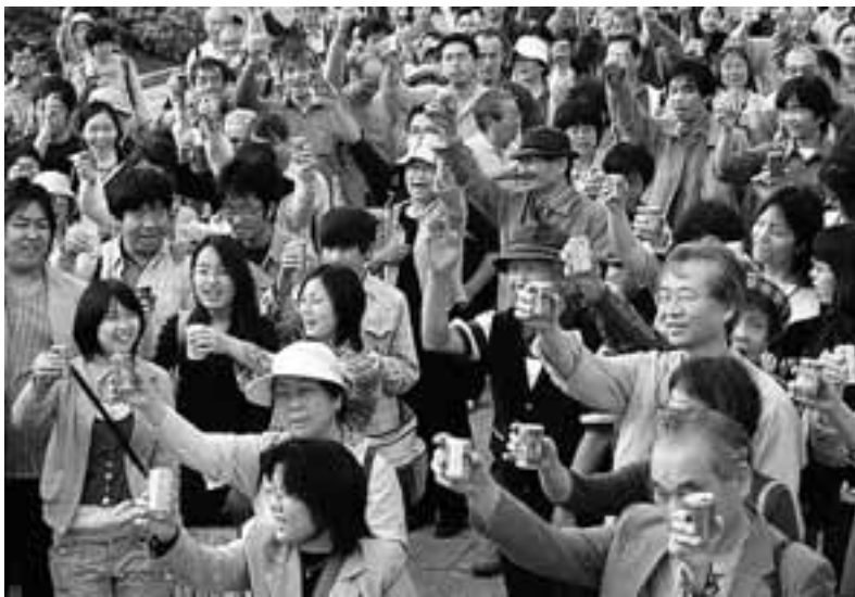
愛労連青年協と愛高教青年部の「9条にカンパイ」には200人(5月3日)