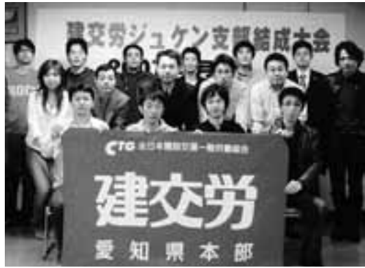
ジューケン支部の結成大会に集まった仲間たち

4月、建交労愛知県本部 造・販売を行なっている日 2社はともに同族会社で 社長が2代目、その母親が 進市にある日本寿健輔にて 春日井市にある株式会社フジモト きたジューケン支部、もう一 にできた中部合同支部フジ 社は廃棄物処理およびその 専務や会長など会社役員と して業務に携わりワンマン 経営が続いてきました。