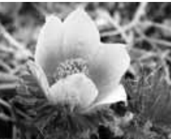
06年6月11日に横岳にて撮影 文・写真 市場文規(あるきですの会代表)

本州では、八ヶ岳(横岳周辺)と白馬岳だけに咲くというツクモグサ(九十九草)。雪解けの稜線に真っ先に咲くこの花に出会いたく