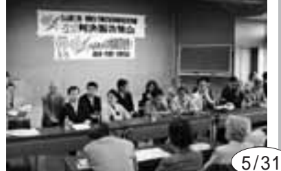
5/31 名古屋三愛朝鮮女子挺身隊訴訟の控訴審は強制連行や強制労働について認めながらも請求を棄却する不当判決

みんなのとりくみ お寄せください 単産・単組や地域でのとりくみを写真(デジタルでも可)と簡単な文章でお寄せください。しめきりは毎月4日までに愛労連事務局必着。詳しくは... 052-871-5433(竹内)まで E-mail post@airoren.gr.jp