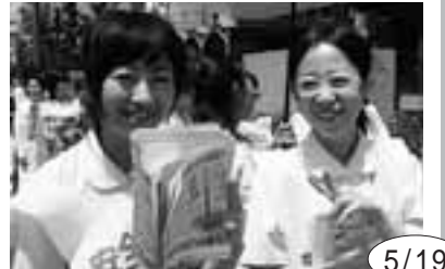
5/19 「東三河ニュースウェブ」を100名で実施。医師・看護師ふやしての署名500筆を集約し元気よくパレード