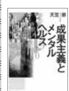
成果主義とメンタルヘルス 天笠 崇 [著] 新日本出版社 定価1,600円+税

心の病と労働組合の役割 著者は精神科医である。うつ病患者などを治療するなかで、「成果主義賃金」と「ストレス」の関係が解明されている。「評価への納得感」がストレスに大きく影響する。成果主義人事管理は、さらにハラスメントと長時間労働をもちたらし、最悪の場合、過労自殺に至る。この問題の解決には、医療だけでは対応できない。「心の病」を減らし、なくすためにいくつかの対策を提示しているが、なかでも労働組合の役割の大きさを強調している。