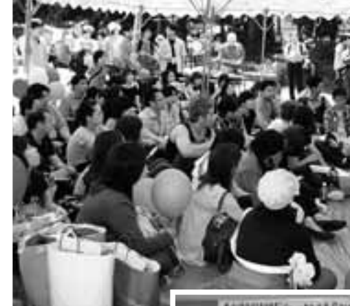
(左)青年大集会の前には11の分科会が開かれ各地のたたかいが交流された