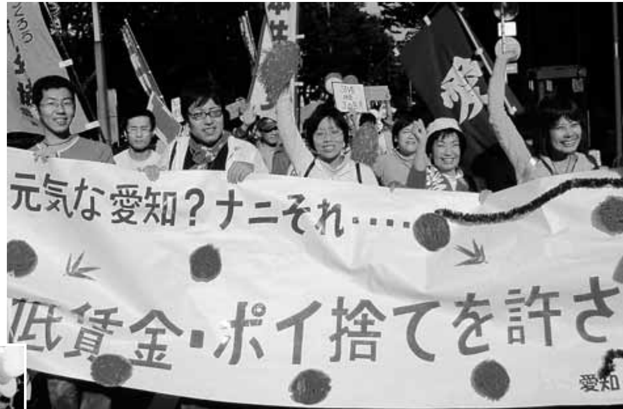
東京で開催された5・20青年大集会には全国から3300人が参加して元気にアピール

いま、青年をとりまく労働環境の悪化が若者から次々と告発されています。最低賃金体験をつうじ、最賃額では人間らしい生活はできないと実感。しかし最賃どころか働く場所も、住むところさえないというネットカフェ難民はじめ、企業の違法・無法の横行に「もう黙ってられない」と各地で立ち上がり、声をあげています。 愛知でも昨年の「あいちde雇用祭」をきっかけに青年の「働き方・働かされ方」に注目。安定雇用を求める署名を集め「全国青年大集会」には80名を超える青年が参加しました。 「最低賃金を1000円に」「安定した雇用を」と要求を大きく掲げ青年たちのたたかいは広がっています。