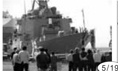
5/19 米海軍駆逐艦ボール・ハミルトンの名古屋港入港に安保破棄実行委員会など3団体が抗議行動