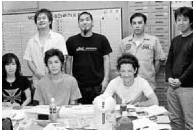
全国一般東伸サービス支部の仲間たち