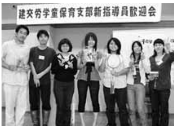
ゲームで賞品をもらってニコリ

「ひとりぼっちの(学童保育)指導員をなくそう!」相談できる仲間を作ろう!を合言葉に、建交労学童保育支部は組織拡大月間にとりくんでいます。6月14日には新任指導員&新入組合員歓迎会を行いました。歓迎会は、組合未加入者にもよびかけ、青年部からも先輩との交流を深め合える場にしたいと多人数が参加しました。分会ごとにわかれたテーブルで食事や歓談を楽しみ、ゲームでは大変な盛り上がりで時間オーバーになるほどでした。参加者からは「初めてやるゲームだつたからおもしろくて興味深かった!」明るく・力強い組合の仲間がたくさんいるんだと、心強く感じ、明日への活力をもらうことが出来まし