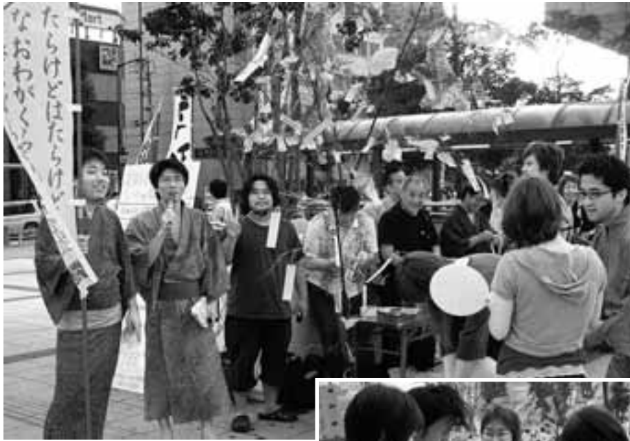
愛労連青年協は七夕(7/7)の夕方、民青同盟とともに金山総合駅で対話・宣伝行動を行いました。浴衣姿で道行く若者たちに、短冊に願いを書いてもらったり、九条署名や最賃署名などを集め、「青年の未来を託せる政治を実現しよう」と訴えました。