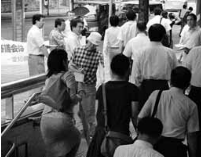
愛知最低賃審議会の答申日に行った宣伝行動(8/28)