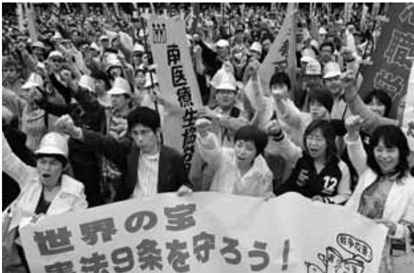
政治を変えようと昨年5月の国民大集会には愛知から619人が参加。

とき 10月28日(日) 文化行事 11:00~11:50 国民大集会 12:00~13:30 ところ 東京・亀戸中央公園 集会終了後デモ行進