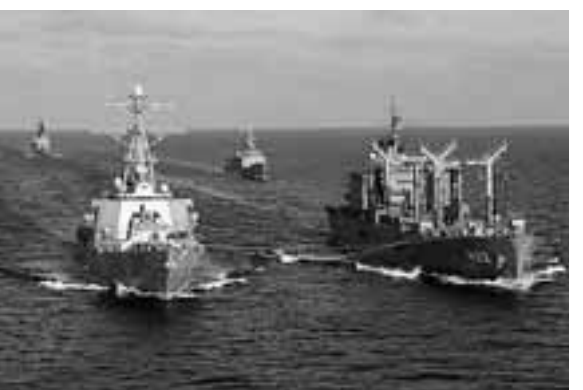
インド洋で給油活動を行う海上自衛隊