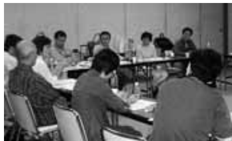
9月29日から30日に行われた合宿