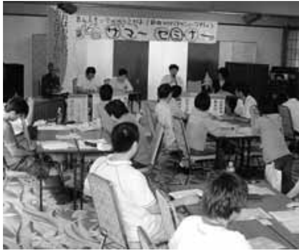
厳しい実態の中でも粘り強く頑張るパネリストの報告に元気をもらったシンポジウム

9月22日から24日まで三重県亀山市の「関ロジック」で第16回東海北陸ブロック「サマーセミナー」がおこなわれました。