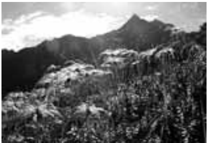
07年9月14日に撮影 チングルマと槍ヶ岳

8月末に、上高地を訪れた方から「自然の力に癒され、力が湧いてきました。アルピニストの市場