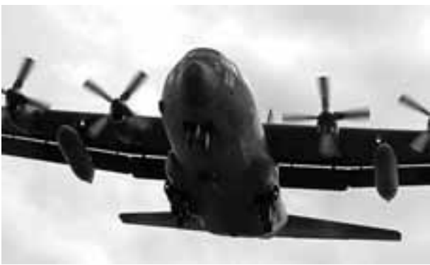
離発着を繰り返すC130H輸送機

自衛隊と米軍による日米共同統合演習が11月5日から16日にかけて実施されています。この演習は2万2500人もの自衛隊員と、艦艇90隻、航空機400機が動員されて行われているものです。