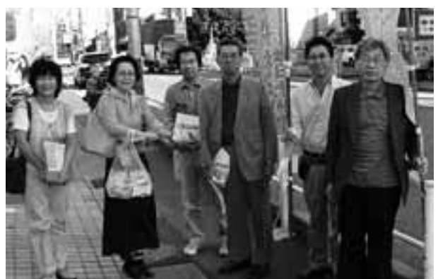
ユニー守山店前での宣伝で守山労連のみなさん

田共同センターに参加し、地域ローラー作戦を開始。前日に署名用紙と協力を訴えるチラシを配布していき、回収にまわっています。参加者からは「街頭よりも効率がよい」と感想が出されています。