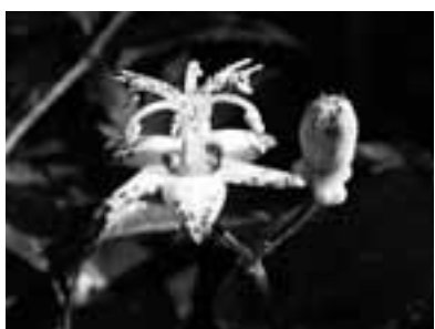
秋を代表する花、ホトトギス 文・写真 市場文規(あるきにすとの会代表)

紅葉の名所・瀬戸岩屋堂、例年なら見頃は11月の20日前後、鳥原川沿いは楓が多く、川面に映る紅葉は多くの観光客を引き寄せています。岩屋堂の横手から山道を辿ると20分ほどで岩巢展望台に出る。ここからは眼下に紅葉に染まる鳥原川、西に尾張平野が広がる。一般の観光客はここまで。ここから東海自然歩道に沿って左に折れ、岩巢山を目指す。1時間程度で山頂に。山頂より手前の小ピークがおすすめ。東には松の緑とコナラのオレンジが鮮やかな東濃の山々、西には広々とした濃尾平野、そして北には御岳と驚沢な景色を独り占めできる。アクセスは愛知環状鉄道中水野駅からコミュニケーションパスが1日3便出ている。