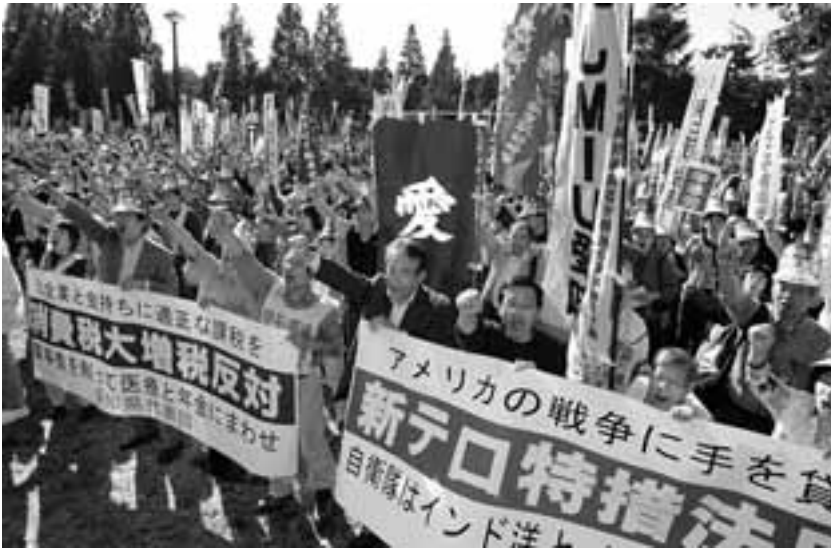
全国から4万2000人、愛知からも300人が参加した10.28国民大集会