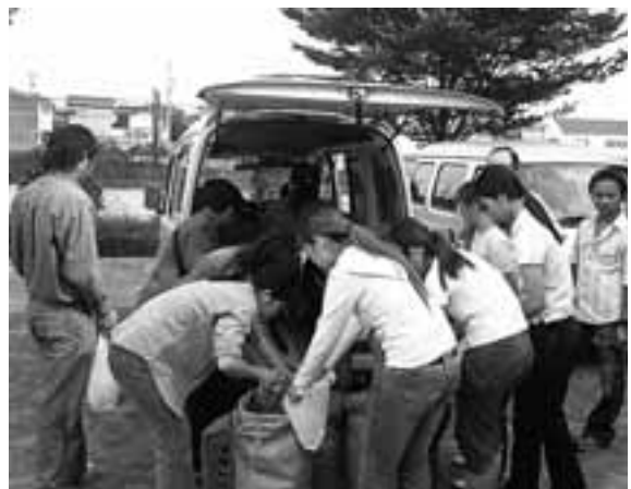
「日本のお米は高い」という研修生に農民連からお米100kgの差し入れ ブログ「ベトナム人研修生支援」 http://rodo110.cocolog-nifty.com/viet_nam/

一方で研修生達は「出国直前に(違法な)契約書にサインさせられた」と言います。旅費の二重取り、家族を脅されたり、さらに別のブローカーが介在していることもわかりました。「外国人研修制度」は廃止も含め、抜本的な改正が必要で