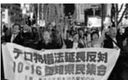
テロ特措法延長反対10・16県民集会