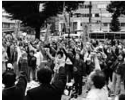
参加者シュプレヒコールを上げる

後期高齢者医療制度の中止や最低保障年金の実現を求め、年金者組合愛知県本部は11月6日、名古屋市中区の栄広場で「愛知年金者一揆」を実施。集会には400人が参加しました。