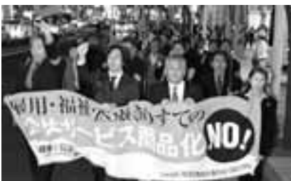
11・2全県労働者決起集会