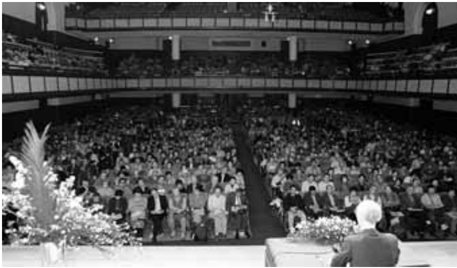
1400人が参加した「憲法九条を守ろう07県民の集い」(11月3日・名古屋市公会堂)