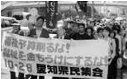
福祉予算削るな10・28県民集会