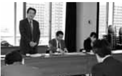
テロ特措法延長反対10・16県民集会