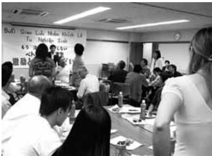
「もう泣き寝入りはしない。」ベトナム人研修生激励と支援のつどい(9月30日)には25名の研修生が参加した

昨年、トヨタ自動車の下請け企業がベトナム人研修生への最賃違反などで労働基準監督署から是正指導をうけました。さらに今春入国管理局から「不正裁定」。研修生に強制帰国の恐れがでました。愛労連は5月の連休明けから支援活動を行い、新たな受け入れ先確保に努力してきました。その結果、9月には全