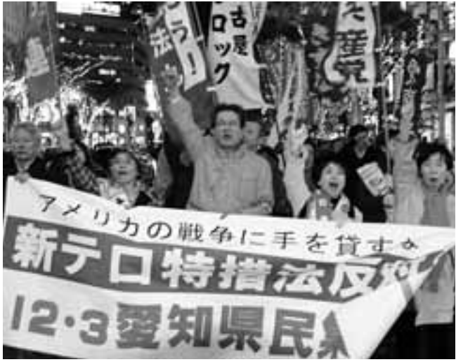
新テロ特措法必ず阻止しよう、ばく大な軍事利権疑惑徹底究明しようといわれた12.3県民集会には250人が参加