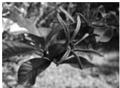
初冬の彩り 富士の麓、07年11月25日撮影

設楽町に暮盤石山という面白い名の山がある。中腹の大小の岩が点在する様から名付けられたもので、暮の勝負に負けた天狗が暮盤