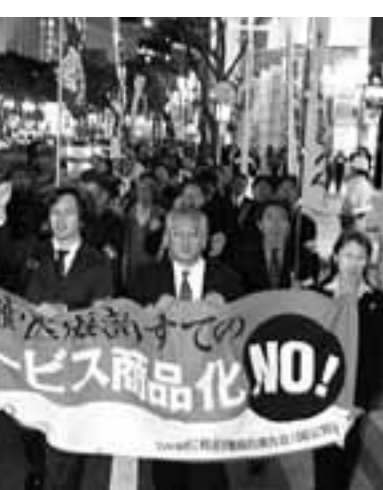
秋年末闘争山場に向けて開催された11.2労働者決起集会には、400人が参加し賃上げや憲法守れと訴えた

愛高教は初任給基準・その他手当の改善などの要求を中心に交渉。格差賃金行政職には導入されましたが教員は阻止。地域手当も全県一律10%を守り抜いています。