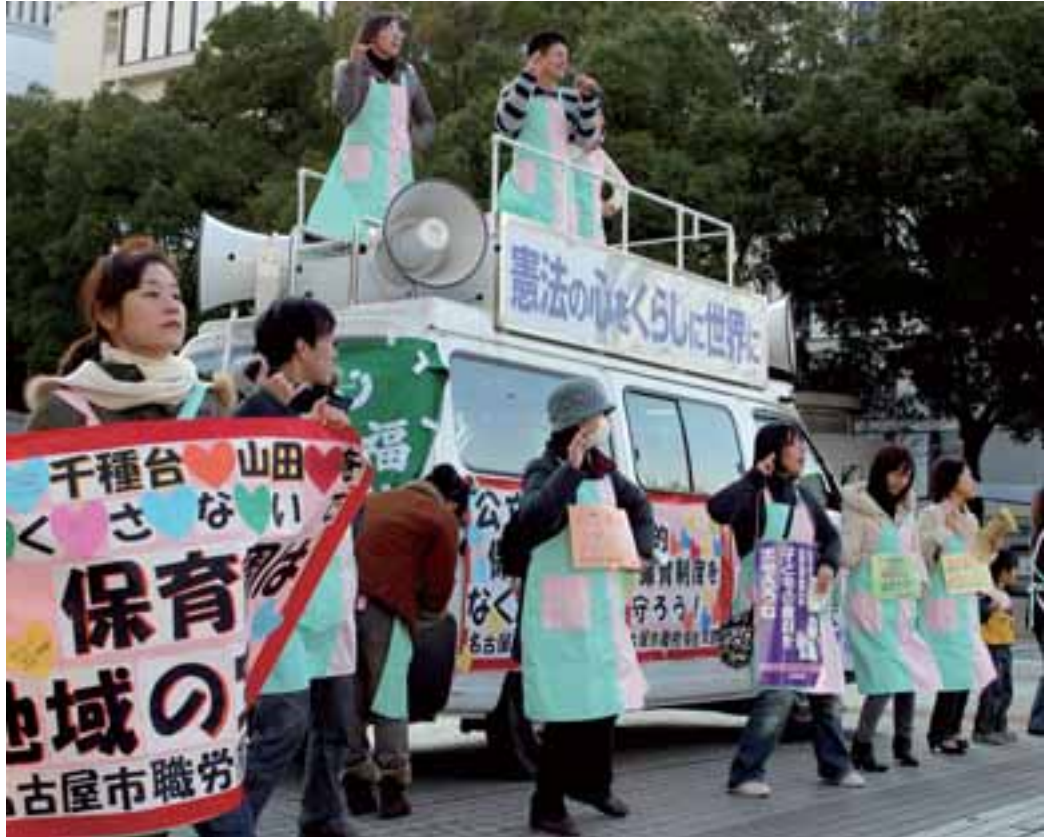
パフォーマンスも交え元気に、公立保育園のはたす役割と大切さを訴え宣伝行動