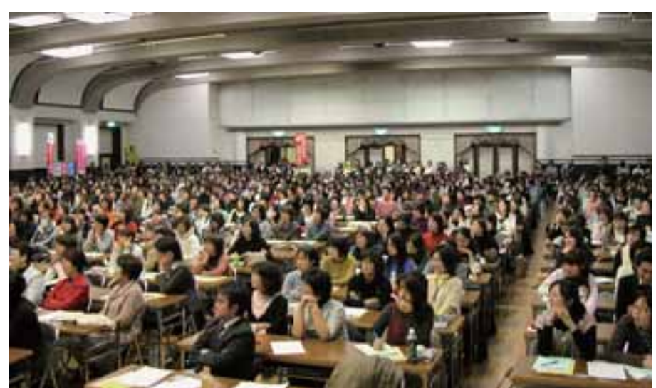
会場を埋め尽くした「公立保育所の民営化は許せない! 12・14大集会」