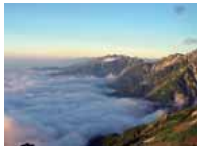
朝陽を浴びて輝く雲海、2002年7月23日撮影 文・写真 市場文規(あるきですとの会代表)

新年おめでとございます。今年の初日の出は見られたでしょうか。太平洋から昇る朝陽を背景に波しぶきがはじける海岸で。それとも山々の重なりの方から昇る朝陽を悴んだ手に息を吹きかけながら眺めたでしょうか。日の出の瞬間、神々しい気持ちになるのは日本人のDNAに刷り込まれた感性でしょうか。 山の朝、押し寄せる雲海に朝陽が射し、刻々とその形と色合いを変えて出会うとき、誰しも今この頂きにて良かったと思ふ感動的なシーンです。この一瞬のために重い荷物を担いで山に上ると言ってもいいくらいです。正月にちなんぞそんな1ショットを紹介しました。