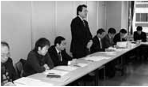
愛知県への要請をおこなう愛労連幹事会

愛労連は1月末に愛知労働局と県産業労働部への要請を行いました。愛知には全国から「出稼ぎ派遣」労働者が集中し、「ネットカフェ難民」が1300人もいます。外国人労働者も全国で一番多く、ひどい労働条件のうえ、社会・労働保険にも未加入。非正規で働く労働者への一定の配慮的表現もありますが、横並び賃上げ否定と徹底した支払い能力論に立つており、春闘型の賃上げを否定しています。 とされています。格差と貧困の最大の原因が労働者の非正規化にあること、反省もなく、二スへの対応としています。しかしこれは企業の二スで 労働時間にかかわる規律」の見直しを求めています。いわゆる残業ただ働き法案である「ホワイトカラーエグゼンプション」の導入です。労働法制的 間て企業の利益は1・8倍、役員報酬は2・7倍、株式報酬は2・8倍、一方労働者の賃金はマイナス3・8%、これが実態です。日本経団連が何と言おうと、労働者の犠牲の上に大儲けを続けてきた事実は明らかです。昨年の怒りの参院選以降、潮目は変わりつつあります。おもしろい情勢の08春闘。「なくせ貧困、ストップ改憲」のスローガンのもと、国民共同の大きな運動で、賃金底上げを実現し、くらしを守りましょう。(克)