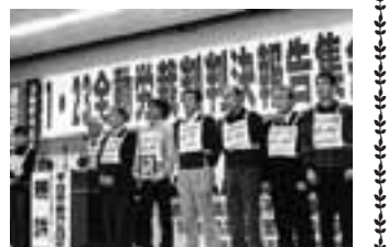
お礼と決意を語る争議団

東京地方裁判所は、1月23日、全動労JR採用差別事件の判決で、所属組合を理由とした違法な差別的取り扱いがあったと認定し、鉄道運輸機構に対し、一人あたり550万円の損害賠償を支払うよう命じる判決を言い渡しました。 判決は、国鉄が分割・民営化」に反対していた全動労を敵視し、採用候補者名簿の作成において、組合所属を理由に全動労組合員を不利に取扱い扱った不当労働行為を認定しました。その上で、国鉄が併存する労働組合に対する中立保持義務に違反し、原告、全動労組合員らのJRへの就職を阻害したと認定しました。 採用差別事件からすでに21年が経過し、不採用になった組合員らに対する適切な救済を図ることは、人道上からも一刻の猶予もならない課題とな 「私たちは、鉄道運輸機構及び日本政府が、判決で示された不当労働行為の事実と損害賠償責任を踏まえ、採用差別事件の全面解決のため交渉のテーブルに着くことを強く求め全力で奮闘する決意です。長期間にわたつての支援に感謝すると同時に、引き続きのご支援をお願いいたします。 私たちが、鉄道運輸機構及び日本政府が、判決で示された不当労働行為の事実と損害賠償責任を踏まえ、採用差別事件の全面解決のため交渉のテーブルに着くことを強く求め全力で奮闘する決意です。長期間にわたつての支援に感謝すると同時に、引き続きのご支援をお願いいたします。