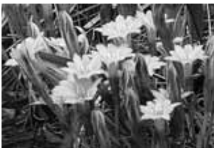
2003年4月29日に撮影 文・写真 市場文規(あるきにすとの会代表)

厳冬期に気軽に歩ける山は?尾張地区なら犬山寂光院から継鹿尾山を経て鳩吹山、豊田猿投山から 瀬戸岩屋堂を経て春日井弥勒山など低山ながら歩きがいのあるコースが沢山ある。その弥勒山の麓に広がる弥勒の森には多くの湿地が広がる。冷えた朝に訪れれば、冬枯れの草木に霜が降り、寒々とした光景を見せてくれる。真つ先に春を告げるのは、シヨウジョウバカマとシデコブシ(3月末)。続いてハルリンドウのコバルトブルーのロゼット。優雅に舞うギフチョウも。足を伸ばして西高森山に登れば、濃尾平野が一望だ。アクセスはJR高蔵寺駅から名鉄バス春日井緑化植物園行き終点下車。