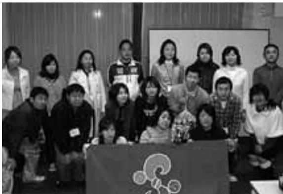
総会に参加した青年部のなかまたち

2月1日(金)に「チュー杯福祉保育」を絵に描いてもらい、愛知県の最低賃金「東海地本の組合員数」などを解答する、ちよつと学べるゲームを解説を交えながら行い、盛り上がりしました。