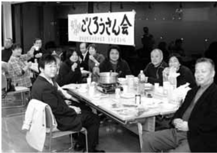
鍋を囲みながらひもじかった生活体験を振り返ったごころうさん会

2月の「最賃生活体験」(1ヶ月間)が終了しました。今回は100人を超す組合員が参加し、大きなとりくみになりました。 とりくみの途中から体験者に感想を聞いてみると、最低賃金が低く、まともな生活ができないが、明らかにになりました。 明らかになりました。ガマンすること自体がストレス。そのいくつかを拾ってみると、「体調をくずしたとき、医者が薬局の薬か迷った。軽度の風邪だったのです。悪化したら医師にも行けない」最初計算したら食費は月1万5千円。鉄工所勤務なので朝食は抜けない。1日500円じゃやっていけない「がまんすること事態がストレスだ」などなど。 愛労連は、この生活体験を3月中にまとめ、4月には労働局交渉を配置し、これにむけて署名行動にもとりくみます。同月末には愛知地方最低賃金審議会の労働者委員の任命がおこなわれます。今年も5人の立候補者をたて、連合独自の偏向任命を改めさせるようとりくみます。 また、職場では非正規労働者の時給引き上げのとりくみとともに、地域で最低賃金の低さを告発する宣伝行動を展開します。 最低賃金の大幅引き上げ・全国一律最賃制確立は「なくせ貧困」運動の重要な課題です。 体験者のみなさん。家計簿を早急に組合役員にお渡しください。3月中に集計します。