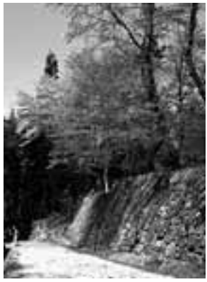
2001年4月22日に岩村城址で撮影 文・写真 市場文規 (あるきにすとの会代表)

名古屋近辺の桜がすっかり散つ た頃、旧岩村町の岩村城址(信長 の叔母、女城主の城)では満開を 迎える。JR恵那駅から1両だけ の明智鉄道に揺られること30分。 岩村駅を降りると重要伝統的建造