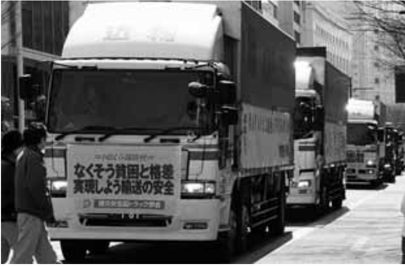
2月23日には名古屋と豊橋で自動車パレードが行われ110台120人が参加

昨春秋、愛知県の最低賃金が20円引き上げられました。これをチャンスに市町村では自治労連のたたかいで20円から200円までの大幅な時給の引き上げを勝ち取りました。今年4月からは改訂パート労働法の施行、さらに改訂最賃法が7月から施行されます。08春闘では連合も全労連も非正規労働者の待遇改善を主要な柱に掲げています。