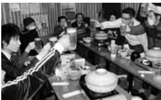
鍋を囲んでカンパイ

全印総連愛知地連青年交流会を金山のモツ鍋屋さんで2月22日に行いました。私が入社してから初めての開催です。青年同士、まず集まって顔見知りになり、組合の活動に積極的に参加してもらえれるようになればと企画しました。 最初は、出席予定の青年が来れなくなったり、平日の夜なので残業の方もいってなかなか人数が集まらなかった。交流会の締めには 全印総連愛知地連青年交流会を金山のモツ鍋屋さんで2月22日に行いました。私が入社してから初めての開催です。青年同士、まず集まって顔見知りになり、組合の活動に積極的に参加してもらえれるようになればと企画しました。 最初は、出席予定の青年が来れなくなったり、平日の夜なので残業の方もいってなかなか人数が集まらなかった。交流会の締めには