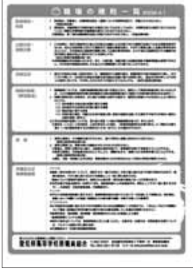
好評、愛高教作成の権利下敷き

組合員ひとり一人が愛高教は5年半ぶりに「権利下敷き」を作成。組合員からは、「愛高教のとりくみの成果がわかり自信を持って活用できる」「育児時短勤務のことがわからなかったのでありがたい」など好評です。この「下敷き」を組合員1人に2枚配布。伊佐地書記長は「ひとり一人の組合員が愛高教の良さを伝えることが大切」と話しています。