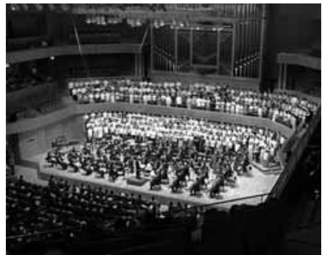
4000人が参加した憲法フェスティバル。名フィルと市民合唱団による演奏は圧巻(5月3日、県芸術劇場にて)

「核兵器も戦争もない平和で公正な世界をめざしてと歩こう」と、被爆地の広島・長崎をめざす2008年原水爆禁止国民平和行進は5月6日に東京・夢の島を出発しました。今年で50周年を迎える平和行進は、今月31日に