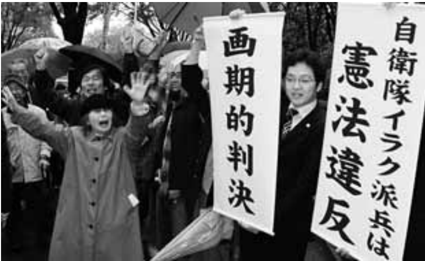
自衛隊のイラク派兵は違憲とする画期的判決に歓声を上げる原告や支援者 (4月17日、名古屋高等裁判所前にて)

「9の日宣伝」県下88カ所 多彩にアピール 憲法改悪反対の世論を広げ、改憲派の息の根を止めようと、憲法9条にちなんだ4月9日、「9の日宣伝」行動が全国各地でとりくまれ、署名やヒラ配りなど多彩に繰り広げられました。愛知県内では早朝から夕方までJRや名鉄、地下鉄の駅前、繁華街やショッピングセンター前など、88カ所で多彩にとりくまれました。