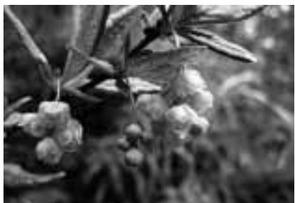
08年1月20日に妻籠宿にて撮影 文・写真 市場文規（あるきにすとの会代表）

41で紹介した春日井市・弥勒の森に4月19日、あるきにすとの会が出掛けた。まずは湿原を覆