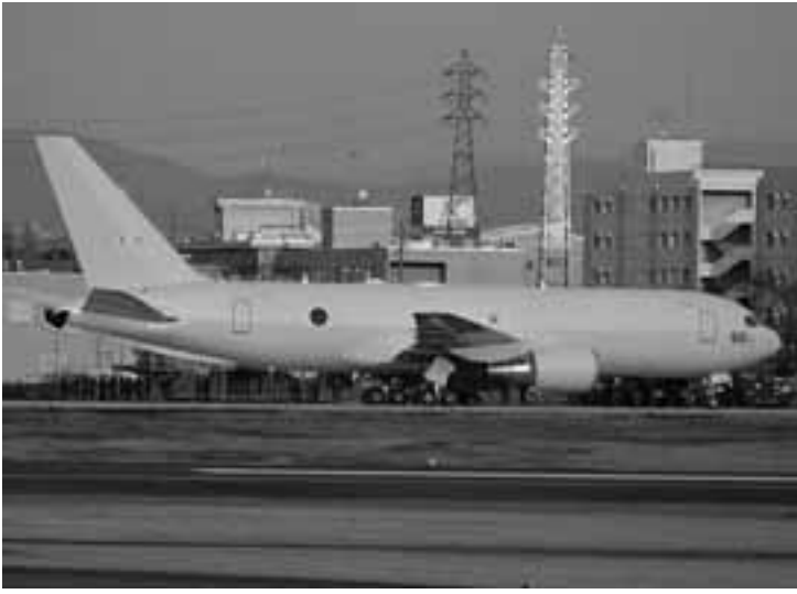
小牧基地に現在2機配備されている空中給油輸送機 (KC767J)