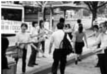
大幅引き上げを求めて宣伝(8/26)