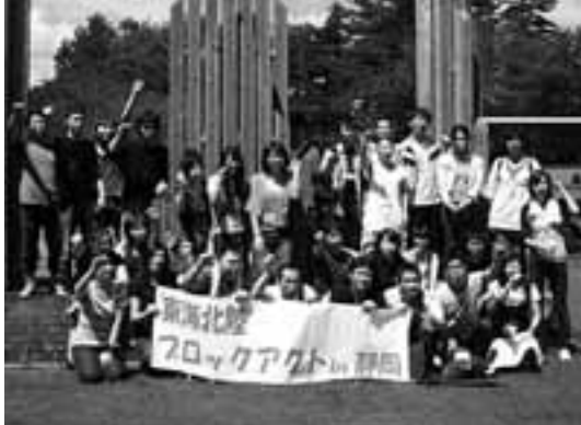
アクトに集まった仲間とハイチーズ

8月30(土)~31日(日)、静岡県立森林公園にて医労連・東海北陸ブロックアクト(青年交流集会)が開かれました。38名が集まり、愛知からは7名が参加しました。 初参加の青年が多く、最初のクイズや学習会ではみんな猫をかぶっていました。深夜まで(一部)は日の出を拝むほどの( )の班交流で、日頃はできないような 仕事や組合活動、恋愛などの悩みを深く話し合い、最後にはすっかり打ち解けて、来年の全国アクト(山梨で会おう!)と約束し合いました。やっぱり相談できる仲間がいるっていいですね! 雨で予定していた天体観測やウォークラリーは行えませんでした。体育館でおこなったドッジボール大会については本気になり、二日酔いも吹き飛ばして汗を流しました。 愛知の青年どおしの新たな繋がりがもて、「スポーツ企画をしたい!」とか心身の健康チェックやうつ病への対応法の学習会「平和&グルメツァー」などの希望が出ました。 今後これらの企画案を実行に移して、青年のつながりを、もっと広めていきたいです。 10月にはアフターアクト交流会を企画しています。医労連以外の方も歓迎します。どしどし参加してください! (医労連青年部発)「アフターアクト交流会」のご案内 10月11日(土) 18時30分 ところ 金山駅北口 「千年の宴」 参加費など問合せは 愛労連青年協 052-871-5433