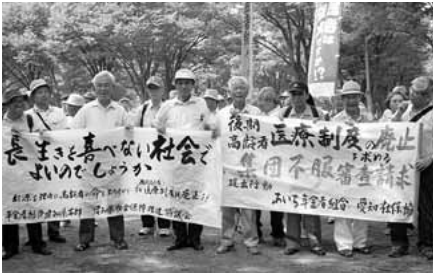
年金者組合と社保協が後期高齢者医療制度で集団不服審査請求 (8/20)