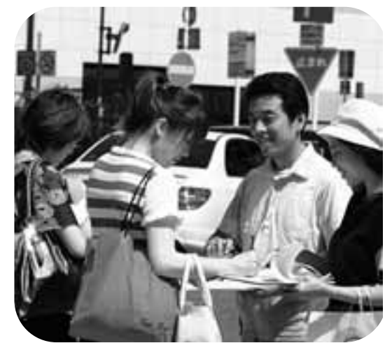
憲法改悪反対共同センターが呼びかけた、2回目となる全県いっせいに九の日宣伝は67カ所を超える駅頭などでとりくまれた

地方では公的病院の医師・看護師不足が深刻で病院の縮小・統廃合が相次いでいます。国の悪政から住民のくらしを守る地方行政