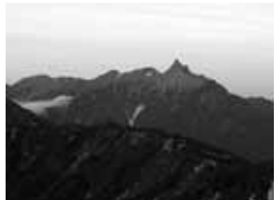
2008年9月2日、燕岳から槍ヶ岳・穂高岳を望む

夏山の雑踏も9月の声を聞くと収まり、静かな山が帰ってくる。それを待って、北アルプス燕岳に。登山口からはいきなりの急登