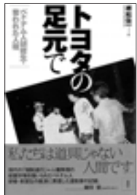
樽松佐一 [著] 四六版・184ページ 風媒社 定価1,300円+税

愛労連は、ベトナム人研修生・実習への賃金未払いや人権侵害問題などを支援してきました。企業と個別に交渉し、入国管理局などと解決を図ってきた過程など、これまでの支援のとりくみ、外国人技能研修・実習制度の問題点を愛労連の樽松佐一事務局長が本にまとめ発刊しました。購入は書店または愛労連事務局まで。