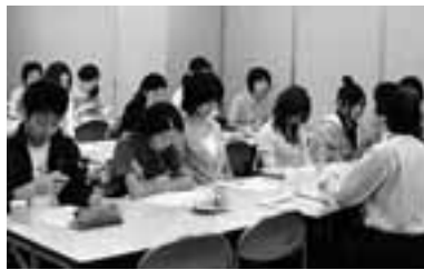
長久手町職労が開いた懇談会

自治労連はこの秋5000人を目標に非正規労働者との対話を進めています。すでに豊川、小坂井、春日井、長久手、犬山で懇談会を実施し、正規21人、非正規44人が加りました。同じ職種の職員との懇談で対