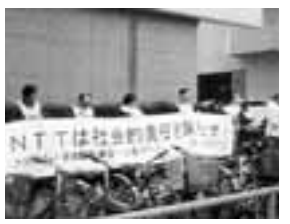
名古屋支店でストライキ