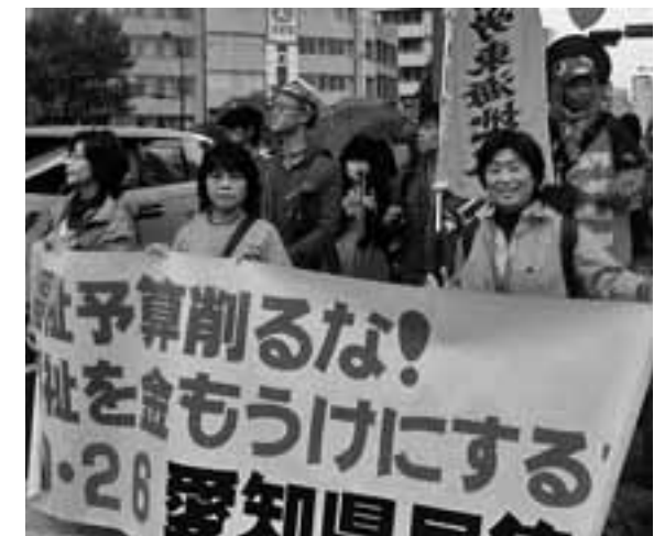
福祉予算を削るな！福祉を金儲けにするな！10・26愛知県民集会には1000人が参加。国や自治体に福祉施策の充実求めアピール

一方、愛知県の最低賃金は昨年の20円引き上げに続き、今年も17円の引き上げが行われました。民間との格差は広がるばかりです。 国が「指針」で「待遇の改善」に取り組み始めたときに「官製ワーキングプア」を拡大することは許されません。今後、愛労連と医労連、建交労、福保労は名古屋市の「マイナス人動」と名古屋市に連帯する非正規労働者の賃金引き上げを要請することになっています。