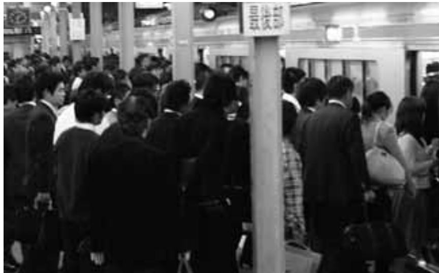
朝のラッシュ時のように定時あがりの労働者であふれる刈谷駅(午後6時10分)

アメリカのサブプライムローンに端を発した金融危機は、リーマンブラザーズの破綻で一気に拡大し世界的な経済危機となっています。日本でも株価暴落や急激な円高だけでなく、実態経済にも深刻な影を落とし始めています。これまで「元気の愛知」と、日本の「好景気」を象徴してきた自動車産業を中心とする愛知でも、減産にともなう期間従業員や派遣の雇い止め、下請け企業の経営悪化が急速に広がっています。