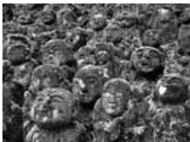
2008年3月2日に愛宕念仏寺にて撮影 文・写真 市場文規(あるきにすとの会代表)

紅葉も一段落し、京の町に静けさが戻る頃、お薦めなのが奥嵯峨野。観光客で賑わう嵐山から北に向かうと、冬枯れの畑の中に芭蕉