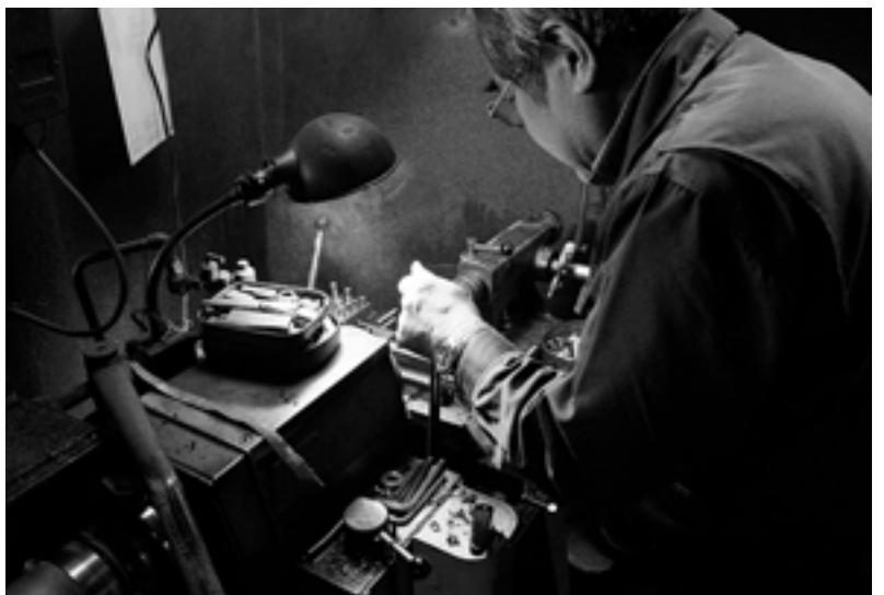
工場の照明は消され、手元のライトのみで旋盤を回す

来年2月には最初の就職組の契約満了が迫っており大量の雇い止めが予想されるといいます。出稼ぎ派遣や外国人技能実習生は、派遣・実習の打ち切りと同時に住居を失うことになり、ネットカフェ難民やホームレスの増加に拍車をかけています。西三河のある市役所では、「派遣会社が市役所玄関前に荷