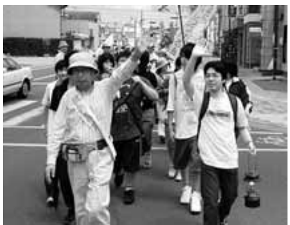
5月31日に、愛知県入りした平和行進でも沿道で「核兵器のない世界を」署名が訴えられ、6月8日までの集約で2883筆が寄せられています