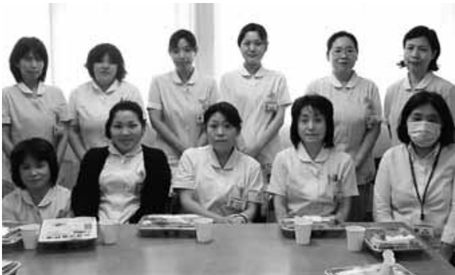
組合に加入した臨時職員の仲間たち