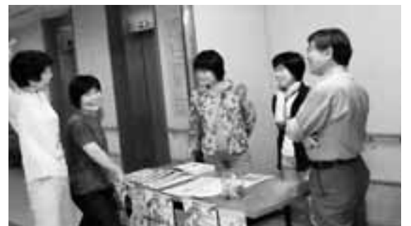
エレベーター横に机を出して職員を待つ

医労連・国共病組名城支部では5月13日から29日まで、組合員拡大の行動にとりくみました。名城病院は昨年、新入職員を多数加入させました。が、病院側の攻撃によって、ほとんどの人が組合を脱退してしまいました。そして、今年の新人歓迎会への参加についても妨害が行われたため、緊急に臨時大会を開催。妨害に対抗する一番の対策は組合員を