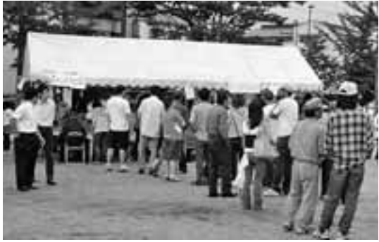
生活保護相談のテントには行列が