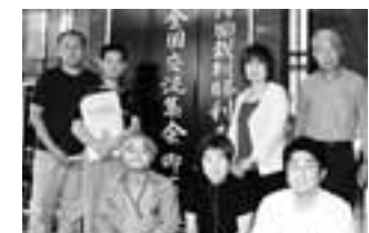
愛知から参加した仲間たち