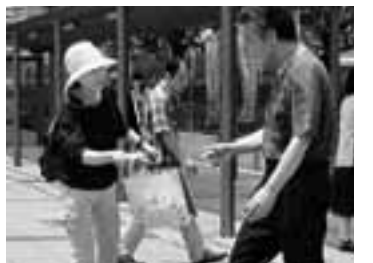
建交労は隔月で宣伝にとりくみ 6月14日で20回目を迎えた

昨年から福祉保育労東海地方本部の執行委員をつとめ、臨時パート部会にも顔を出しています。1年更新