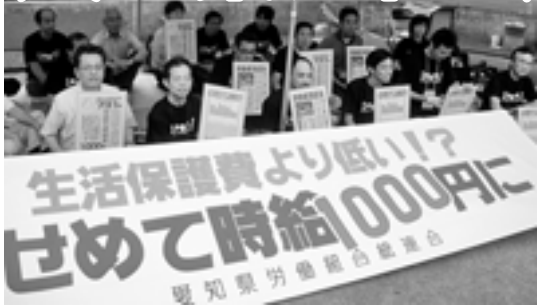
6月18日のハンストには50人が参加

09年の最低賃金引き上げにむけた議論が中央最低賃金審議会で始まりました。使用者側委員(財界)は今日の不況を口実に「今年引き上げはゼロ」を主張。また労働者側委員(連合)も当初から「自制して15円」という要求にとどまっています。