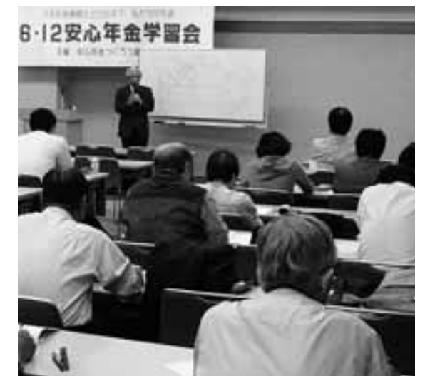
安心年金つくり愛知の会は6月12日学習会を開催

ており効果が疑問視されています。やはり公的年金は国の責任で安定した業務運営をおこなうべきです。