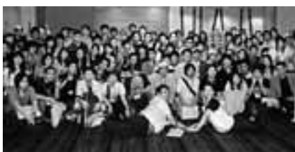
おきプロに参加した愛知の青年たち

自治労連結成20周年記念行事として、6月12日から14日、沖縄に全国から1200人が集まる青年が集まる「おきプロ」(おきなわプロジェクト)が開催されました。様々な分科会では改めて、自治体労働者として働くこと、平和や基地問題、環境などについて考え、交流す