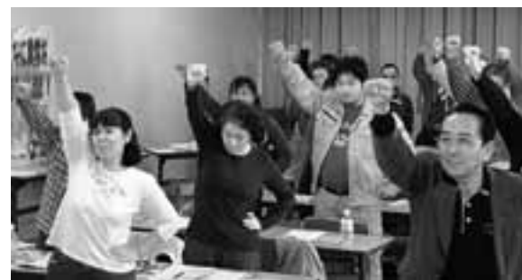
集会最後には団結ガンパロウで意思統一

安井書記長は「大会で決めた目標に向けて、名簿づくり、誰が誰をあたるか、体制づくり、決起集会、ソーンの行動」と順をおつてすすめています」と話し、こうした地道なとりくみが成果としてあらわれてきています。