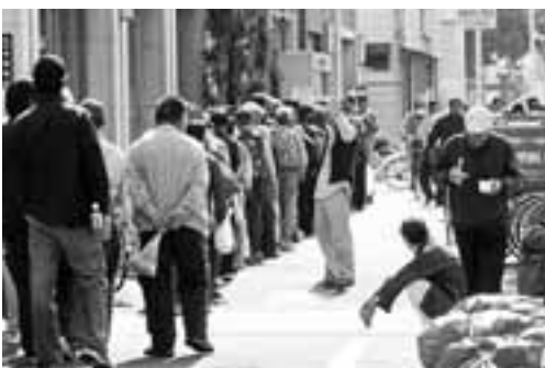
中村区役所の前に並ぶ人たち

春日井市や小牧市を主な活動エリアとし、誰でも加入できる個人加盟制の労働組合、尾張中部ユニオンが誕生しました。 11月15日に春日井市内のレディヤン春日井でおこなわれた結成大会には、派遣切りにあい尾中地区労連に相談してきた労働者や仕事を求めて求職活動をしている人たちが20人と、ユニオン結成を支援してきた尾中地区労連のサポーターなど合計40人が参加しました。 結成のきっかけとなったのは、尾中地区労連が今年2月から、地区労連や地域の日本共産党へ労働相談や生活相談に訪れた人たちに声をかけ、月に1度の割合で開催してきた交流会、毎月、交流会には7、8人前後の対象者たちと、サポーター10人前後が集まりました。そして、話し合いの中で個人でも加入できる労働組合の存在意義などを学び、地域ユニオンの必要性について語り合ってきた。また、この交流会には毎回、地区労連が軽食と飲み物を準備し、参加者から