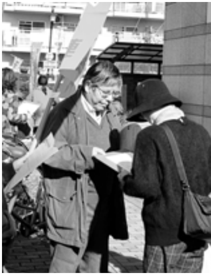
名古屋南ハローワークでのアンケート

愛労連と各地域労連は秋の地域総行動の一環として11月18日に県下8カ所のハローワーク前で求職者アンケートを行いました。午前中の1〜2時間でしたが3