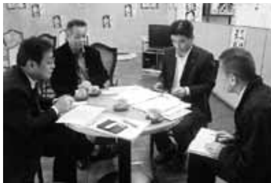
要請をおこなう愛労連と愛知国公の役員ら

愛労連幹事会と愛知国公共同で11月6日、12日の2回、26人の地もと国会議員事務所を総勢43人でまわり、「社会保障と教育予算の拡充を求める要請」「雇用と生活を守る緊急対策を求める要請（愛労連）」「日本年金機構の設置凍結と公的年金の充実を求める請願」「行政改革反対の請願（愛知国公）」で要請・懇談をおこないました。 地もと秘書あるいは事務