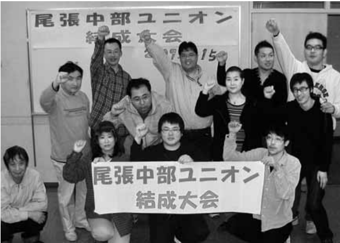
尾張中部ユニオンを結成し、元気いっぱいの仲間たち