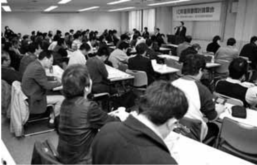
春闘討論集会には102人が参加

生活実態・生計費調査を職場と地域から「賃下げ攻撃」との対決軸は、「生活できる賃金」の保障です。愛労連はそのために、来春闘で「生活実態・生計費調査」をすすめることにしています。 貧困が可視化するほど蓄積し、社会全体が地盤沈下している現在、賃上げは個人消費を拡大し、中小零細企業の活性化につながることを、それが内需拡大へとつながり経済の民主的再生への道につながっていることを明らかにしてたたかう必要があります。 愛労連は、来春闘で新年早々から「賃上げは当然」「労働者の所得を増やしてこそ、経済が活性化される」ことを、これまで以上に労働者・国民に訴えていきます。