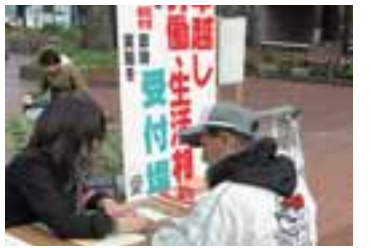
労働・生活相談に訪れた相談者

西柳公園でおこなわれた「越冬活動」にも参加。カニ15万円余を集約し、お米と現金を寄付しました。 また2月28日には「反貧困ネットワーク」の結成にむけた「決起集会」を開催することになっており、より幅広い反貧困のとりくみを広げていくことにしています。