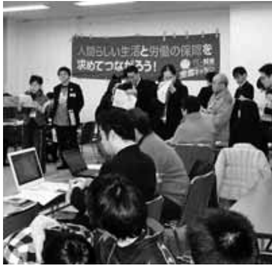
相談会開始前に打ち合わせをするスタッフ

には、37の方が相談に訪れ、県下の派遣村では最高となる170人の要員やボランティアが支えました。このとりくみは愛知派遣村実行委員会が主催、一宮地区労連が共催しました。