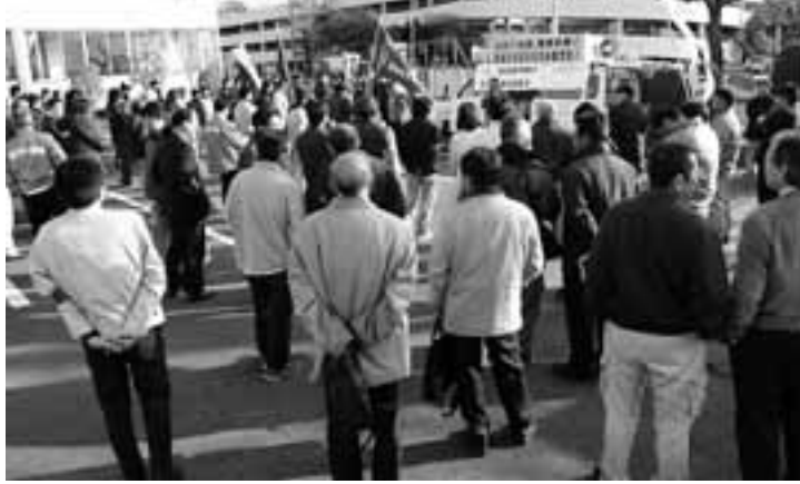
150人が参加した名港労協のストライキ（3月26日）