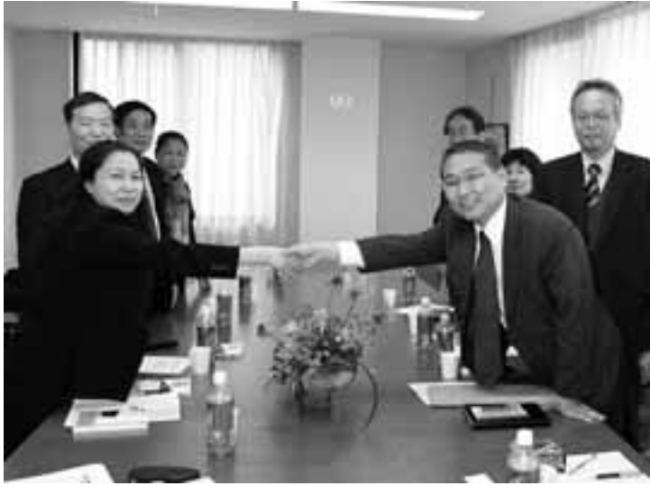
VGCLのホン副議長と連帯の握手を交わす樽松議長