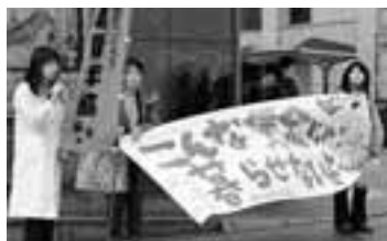
最賃引き上げを訴えて青年協とパ臨連が宣伝（3月14日）

3月19日に労働者派遣法の政府「改正」案が確定し、今国会に上程されています。しかし、政府の「改正」案は大きな問題点や「抜け穴」があり、そのままだと成立させるわけにはいきません。「抜け穴」の第1は、「製造業派遣原則禁止」のうち、「常型型派遣」を除くとしていることです。「常型型」のなかに