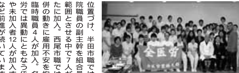
全医労豊橋支部ではほぼ全員が加入

新年度に入り、職場では 新人職員や社員を迎えてい ます。愛労連は3月から5 月を春の組織拡大月間に設 定し、新規採用者の拡大と 同時に非正規労働者への加 入よびかけを最大の重点に とりくみを進めています。