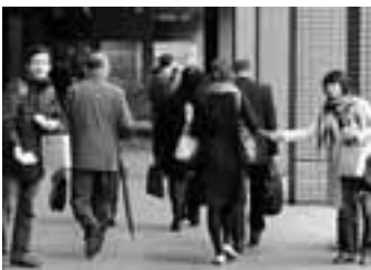
愛労連の新社会人向け宣伝

医労連は年間を通じて組 織拡大を正面に据えてとり くみを進めています。新規 職員の組合員拡大では4月 8日現在で500人を突破 し、傘下の18組合で成果を