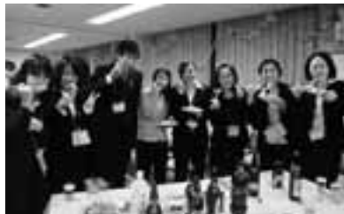
名古屋市立病院労組の歓迎会

自治労連では4月9日現 在、新規採用者だけで68 0人が組合に加入。単組で は港職労や瀬戸市職労、中 水労、名水労、岩倉市職が 100%を達成。9割を超 えたのは豊橋市職労、幸田 町職労、犬山市職労、名古 屋病院労組で100%達成 に向けて奮闘が続いていま す。県下全体では、すでに 5割を超え、昨年の49%を 上回っています。