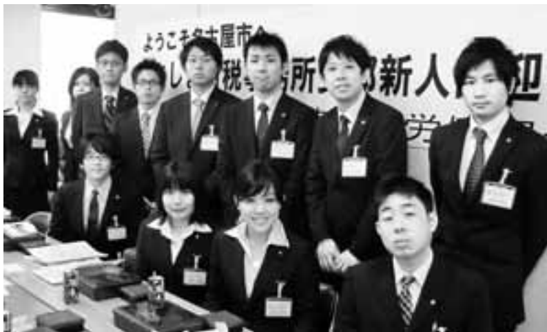
名古屋市では「機構改革」により各区役所から税務を市税事務所 に集約。ささしま市税事務所では、4月1日スタートのあわただ しい中でも新人への働きかけを大切におこない全員が加入。