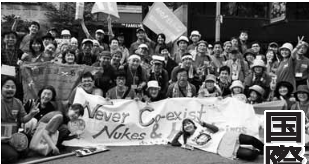
マンハッタンでのパレードを終えた愛知の代表団(5/2)

「核兵器廃絶の国際交渉開始合意を今回のNPT再検討会議で」と5月2日、ニューヨークのマンハッタンに1万人が結集。日本から1500人、愛知からも130人以上が参加しました。