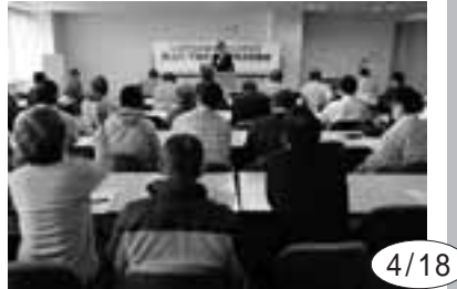
4/18 賃下げ・下請け守る愛知県起集会には60人が参加。集会後にはトヨタ総行動での下請けアンケート結果を配布