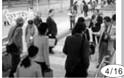
4/16 最低賃金引き上げを求め早朝宣伝。毎年恒例のハンガーストライキは来月6月17日に実施