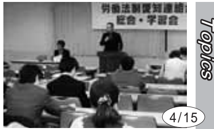
4/15 労働法制愛知連結会が総会と学習会を開催。今後、財界が狙う労働者の働き方について学ぶ