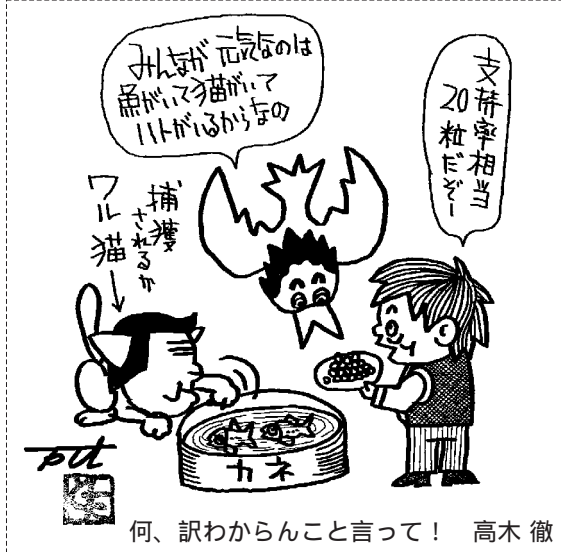
何、訳わからんこと言って! 高木 徹