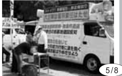
5/8 憲法と平和を守る愛知の会が毎週定例の土曜日宣伝。普天間基地撤去の署名に若い人の反応が目立つ