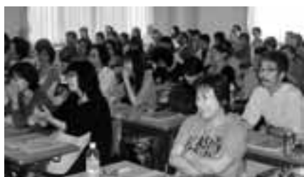
医療研などは未組織職場を必ず誘って

国共病組東海病院支部は、かつて97%の組織率を誇っていましたが、徐々に組合員が減り、3年前には一ケタに。しかし、単組の書記長と県医労連の役員とが粘り強く通う中で一昨年から連続拡大にとりくみ、昨年からは月2人を目標に奮闘。3年前の5倍にまで到達しました。