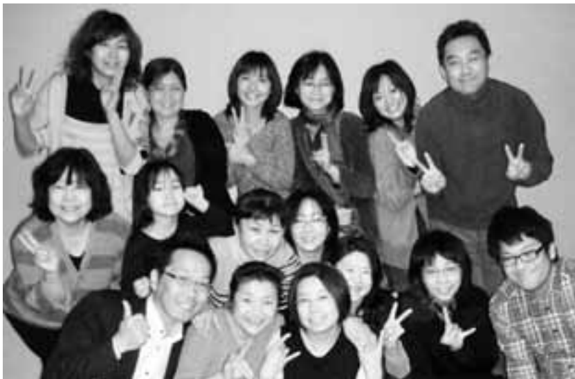
毎月2人の拡大目標を掲げてがんばる国共病組東海病院支部の仲間