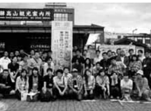
昨年のサマーセミナーの様子(岐阜県飛騨市)

第19回サマーセミナー in 富山 とき 9月18日(土)~20日(月) ところ 富山県ふれあいの里「ささみね」 参加費 19,500円(2泊3日) 11,500円(1泊2日)など