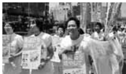
医師・看護師増やせとナースウェーブ

医労連は1990年代後半から約10年にわたって1万5000人を前後する停滞が続いてきました。しかし、「組織の拡大こそ要求実現への近道」と組織拡大に奮起。毎年夏に開催する定期大会を前に、07年から前年を上回る増勢で大会を迎え、08年、09年は過去最高を更新してきました。今年も定期大会を前に、22単組が純増を実現し、全体で昨年を161人上回る1万