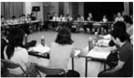
合宿で組織拡大・共済推進会議(09/9)

また、愛知県医労連は常時「組織拡大FAXニュース」を発行。執行委員会からの方針や行動の提起時だけでなく、傘下の組合で加入者が1人でもあれば必ず発行し、その経験を他の組合でもいかせるようにしています。春の新人を迎える時期には、毎日、発行されています。