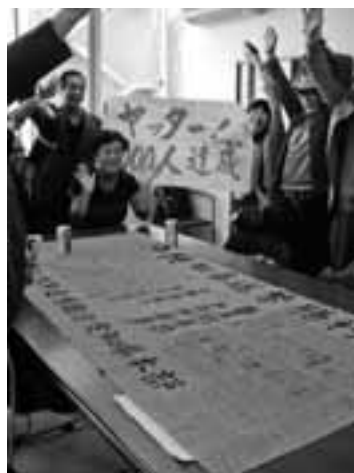
年金者組合が沖縄知事選勝利の1000人署名を達成。署名を持ち代表者が沖縄支援に入る

辺野古美ら海に杭1本打たせぬ 翌16日、一行は辺野古すわりこみテント村へ。キャンプシユワブを洋上からみました。海浜のフェンス越