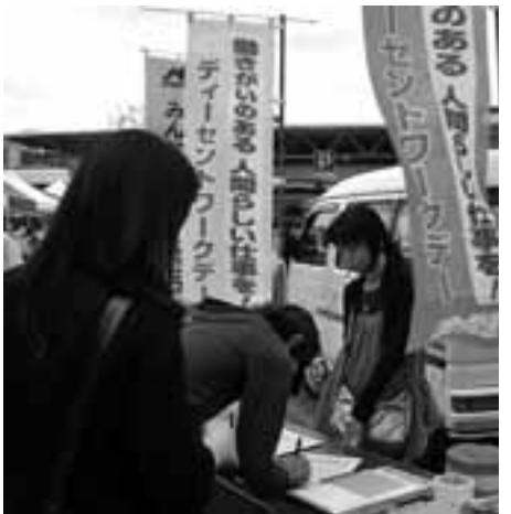
10月16日、パ臨連が中心となり非正規の処遇改善を求めておこなったデーセントワーク宣伝で署名する若者

信費の低さが特徴となっています。加えて被服費(被服・履き物、洗濯代など)も総じて金額が低くおさまりました。