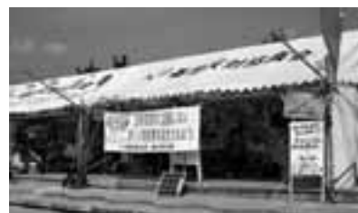
辺野古の海を前に抗議の座り込み

全労連は、10月15~17日の3日間、沖縄基地調査と、沖縄県知事選挙で県民とともにたたかうための行動を行いました。基地のない新しい沖縄をめざすイハ洋一氏(前宜野湾市長)を中心に、沖縄知事選挙はいま、歴史的な熱いたたかいとなっています。