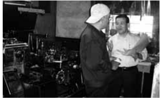
調査の意義を聞く事業主の方(手前)