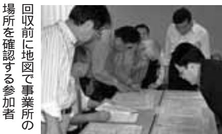
回収前に地図で事業所の場所を確認する参加者

年賀状の季節となった。年賀状を買って欲しいとあちこちから頼まれる。大した枚数でもないのに、義理の板ばさみとなってちょっとつらい。どうやら郵便職員へのノルマが発生源らしい。そんな押しつけをしながら、書く人は書くし、