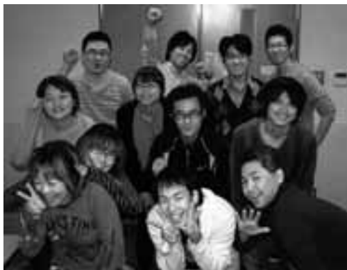
総会に向けて本音を出し合った参加者

10月26日(火)に愛労連青年協代表委員会を開催し、7単産14人が参加しました。総会議案を執行部が説明したのち、職場の実態や活動についてそれぞれ発言。「職場は多忙だが、ボウリング大会に参加した青年が、楽しかった。他職種との交流で視野も広がった」と言っていた(愛高教)、「忙しい青年によびかけ、企画の参加者を集めるのは大変。負担がひとりに集中しないように努力したい(福保)」、「新人への声かけが難しい。組合ってなに? という新人に興味を持ってもらえる活動をしていきたい(自治労連)」、「終わりの後の活動の報告書・ニュースづくりが大切。楽しい企画や共済などを活用し、誘っている(全印総連)」、「平和ツアーをおこなった。今後の目標として、毎