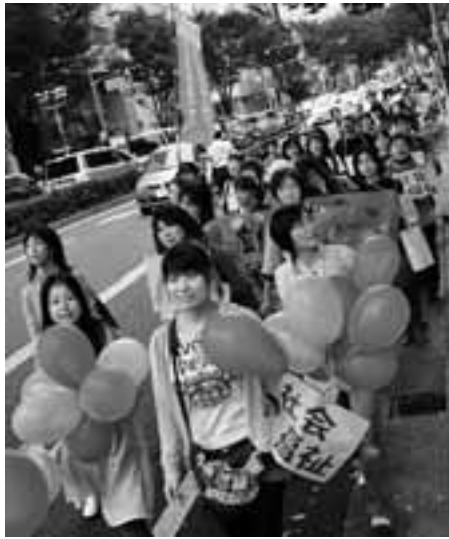
デモ行進を風船やプラカードでアピール