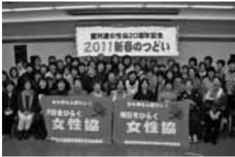
参加者みんなで「ハイポーズ」