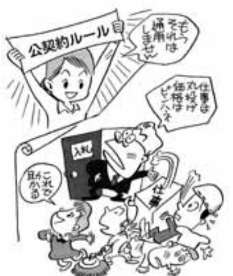
「公契約法の実現をめざす大阪懇談会」パンフより

この間、千葉県野田市、神奈川県川崎市で公契約条例が制定されています(下表参照)。賃金・労働条件