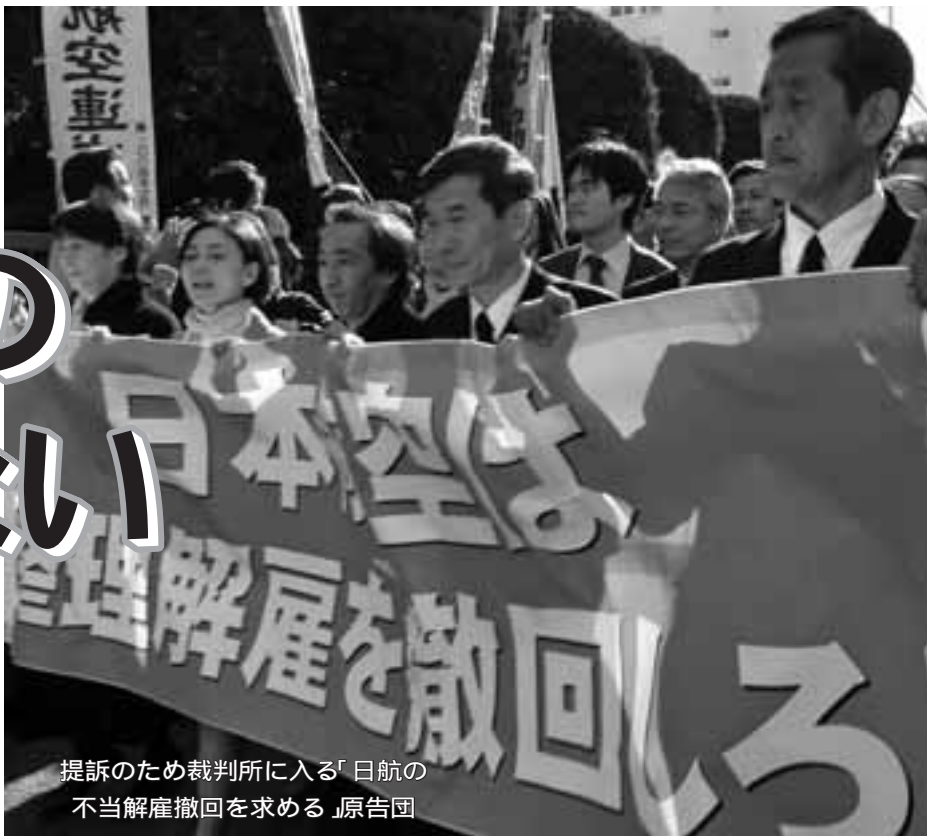
提訴のため裁判所に入る「日航の 不当解雇撤回を求める」原告団

日本経団連は1月17日、2011年版「経営労働政策委員会報告」を発表しました。この報告は財界の中心部である経団連が春闘の前に発表している「労使交渉に臨む際の基本姿勢と考え方」ですが、その内容は国民生活や労働者の要求を無視した「賃上げ拒絶」の姿勢をしめしており、大企業本位の身勝手な中身になっています。