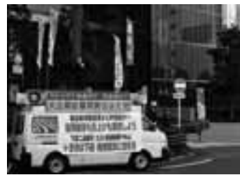
ミッドランド前の宣伝行動

スクエア前でおこない、11春闘を力強くスタートさせました。リーマンショック後もエコカー補助金などでV字回復を果たしたトヨタですが、国内でのいっその効率化をすすめる、海外生産に転換しようとしています。今こそ大企業が雇用・就職・賃金破壊打開に向け、イニシアチブを発揮することを求めます。(安)