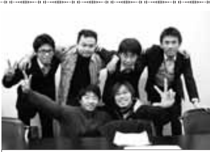
名古屋港管理組合 職員労働組合青年部

昨年9月に新庁舎へ移転したばかりの港職労青年部。彼らの仕事は、港の仕事をやりながら、クレインの維持管理、修