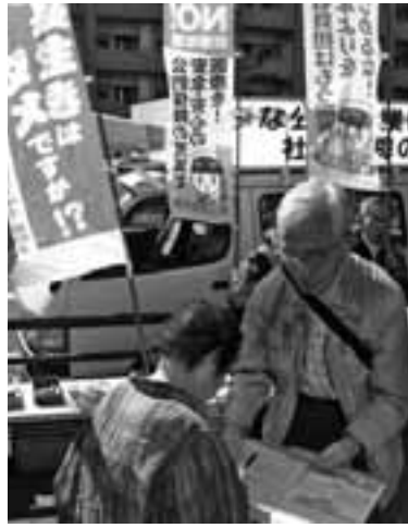
覚王山日泰寺で「後期高齢者医療制度廃止」を求める署名行動

さらに国保の運営を現行の市町村単位から都道府県に広域化することも狙われており、自治体からの一般財源投入をできなくし、歯止めのない国保料(税)引