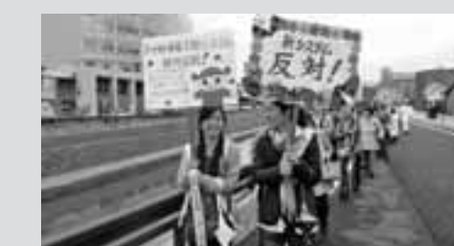
尾張東メーデー 120人が参加