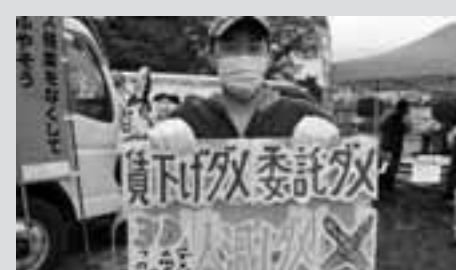
尾張中部地区メーデー 300人が参加