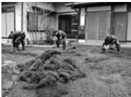
被災者の庭でヘドロにまみれた芝生を剥がすボランティアの3人

東日本大震災救援ボランティア 岩手県大船渡市 4月21～26日 被災者のたくましさ と心遣いに元気もらった