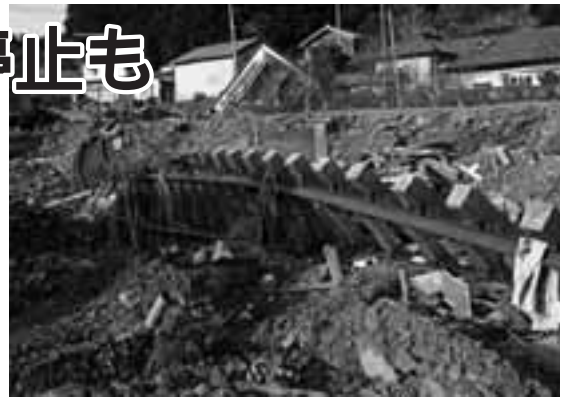
津波で曲がりくねった線路(岩手県大船渡市)