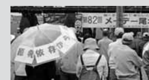
尾北地域メーデー 150人が参加