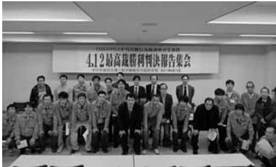
最高裁勝利判決報告集会上に集まった仲間たち(4月12日、大阪市内)