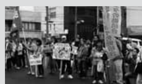
安城地区メーデー 230人が参加