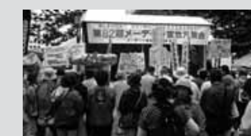
一宮地方メーデー 200人が参加