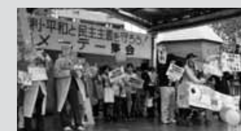
東三河地区メーデー 300人が参加

「ごいいます」「苦勞様です」と被災地の方たちから暖かい感謝の言葉を受けてきました。