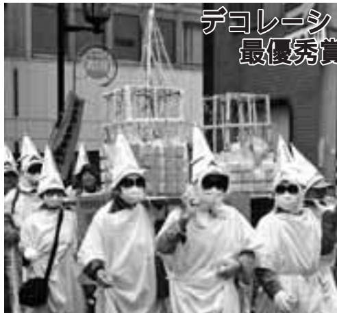
デコレーション 最優秀賞