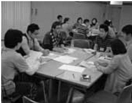
熱心に班討論する参加者たち

5月21日、震災ボランティア報告会をおこない、自治体や医療関係者、弁護士など5人からお話を聞きました。参加者は45人でしたが、それぞれがとても多くのことを考えさせられました。