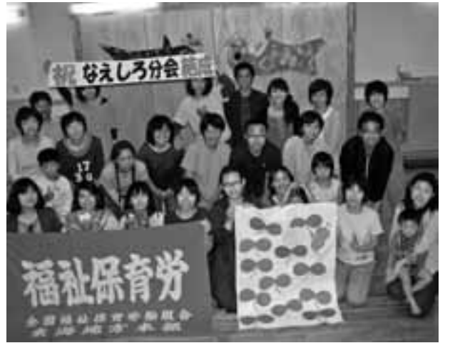
総会後みんなで「ハイポーズ」 子どもたちも緊張半分で「ピースサイン」

5月11日、守山区に「なえしる保育園分會」が新たに誕生しました! 名古屋市の公立苗代保育園が民営化される事になり、私たち福保労の分會がある法人が「よりよい保育