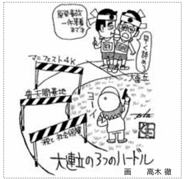
画 高木 徹

今回の震災の経験を風化させることなく、現地の様子を直接的でなくても「知る、感じる、考える、経験すること」がとても大切だと思います。また第2弾も計画したいです。(青年協幹事会発)