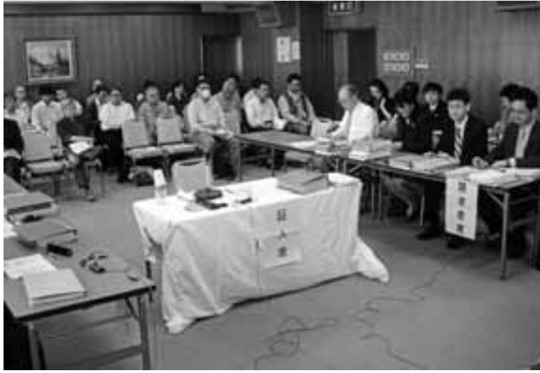
公開口頭審理に参加した傍聴者と請求者（5月18日、桜華会館）