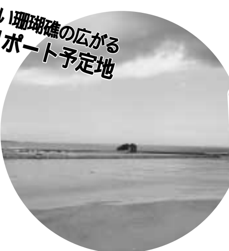
美しい珊瑚礁の広がるヘリポート予定地