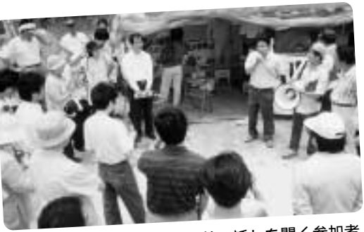
ヘリポート予定地団結小屋前で話しを聞く参加者