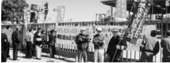
3・12「規制緩和反対」24時間ゼネスト