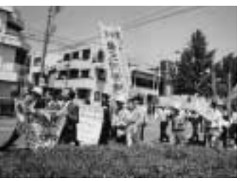
豊橋公園児童遊園地