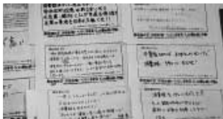
5. 20怒りのFAX行動(栄小公園)