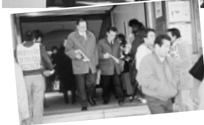
県庁前のシユブレビル 寒かった朝ピラ (地下鉄名古屋線)

県庁前では午前中、四〇人の休戦部隊が、中立組合をはじめ「連合」傘下の四三組合に「解雇規制法・労働者保護法の制定」署名や最賃、万博署名などを持ち、