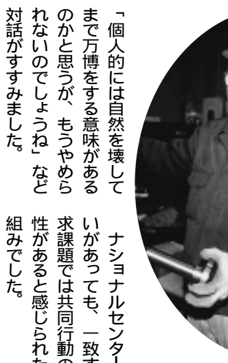
“日本の優れた技術が失われていく”と嘆くおやじさん(中小企業訪問で)

「個人的には自然を壊してまで万博をする意味があるのかと思うが、もうやめられないのじゃないか」とあきらめ顔で話してくれました。