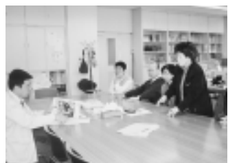
話がはずんだ労組訪問

大幅賃上げで不況打開を、大企業の身勝手なリストラ反対、自公三党の悪政にもう黙ってはおられない！要求と怒りの声が全国で広がった列島騒然25怒りの総行動。愛知では、多くの仲間が早朝の駅頭での宣伝、自治体や国の出先機関への要請、夜のデモまで、県民にアピールしました。