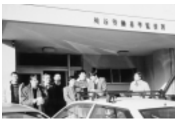
刈谷労働基準監督署へ要請