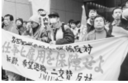
名古屋工場閉鎖反対とたたかうJMIU内田油圧支部

二人が最賃生活で体を張って証明したものは四項目。しかし、こんな生活が「健康で文化的な最低限度の生活」でしょうか。