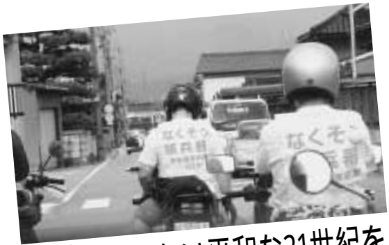
全労連青年部がとりこんでいる反核・平和運動の総称で愛知では反核ライダーでおなじみ