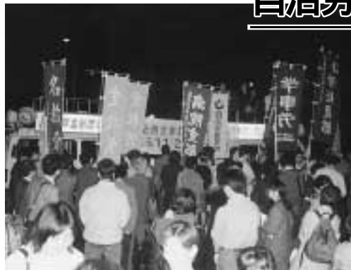
名城東小公園には1200人が参加。集会のあと県庁までデモ行進