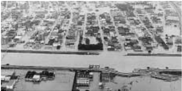
決壊した新川