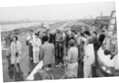
洗堰をみる参加者