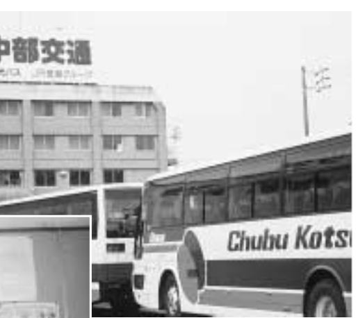
建交労の掲示板には、署名と激励の声がところせましと貼られている。右は中交労組の掲示板

社長の解散通告は、寝耳に水でした。東海豪雨災害で大きな被害を受けたという理由です。規制緩和による運賃のダンピングや多角経営の失敗、東海豪雨による被害も加わり「赤字経営をこれ以上続けられない」というのです。