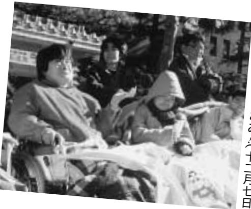
県庁前ですわりこみ(十一月七日)