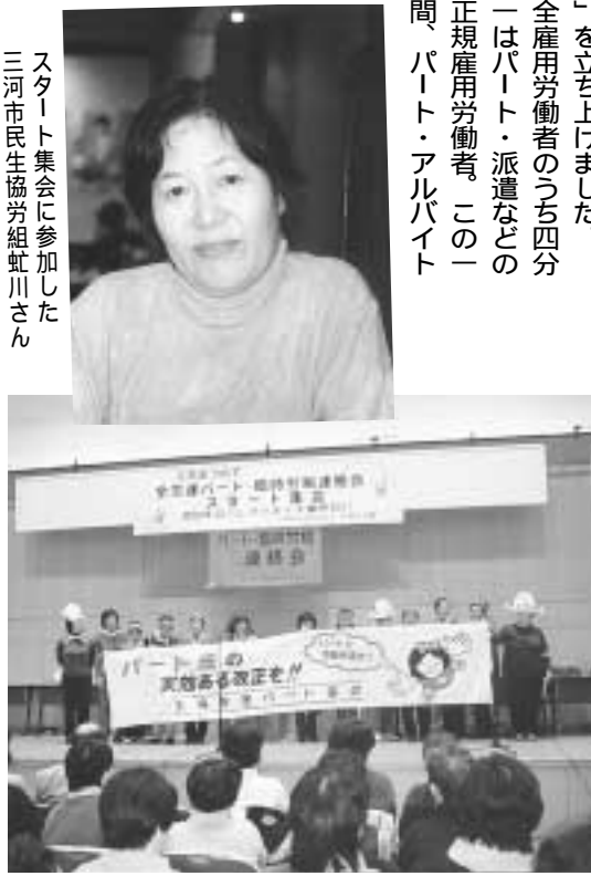
パート、臨時労働者連絡会の結成 (11月17日)

十一月十七日、全労連は六二万人増、派遣労働者は一〇万人も増えていす。政府・財界の二十一世紀戦略のもとで、増え続ける非正規労働者のうち四分の一はパート・派遣などの非正規雇用労働者。この一年間、パート・アルバイト