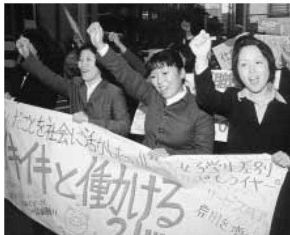
11月23日、「就職難をふっとばそう！」とシンポジウムのあと、リクルートスーツパレードをする女子学生の会の仲間

今春の大学卒業者の就職率は戦後最悪を記録し、今年の一〇月一日現在の就職内定率は、大学生男子で六六・〇％、大学生女子で五九・七％、短大生で三六・六％。就職戦線は超超氷河期が続いています。企業の採用は年々早まり、今年は三年生の夏から