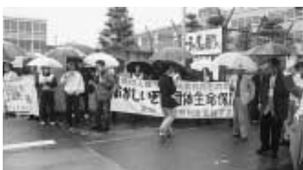
住友軽金属前での集会

県独自の対策を迫りましたが、国基準という冷たい回答でした。参加者は、「鳥取では三〇〇万円の再建支援をしているのになぜ愛知でできないのか。万博・空港より生活再建に税金を！」と迫りました。 県経営者協会や商工会議所には、「愛知就職難に泣き寝入りしない女子学生の会」の代表が、雇用創出を訴えました。